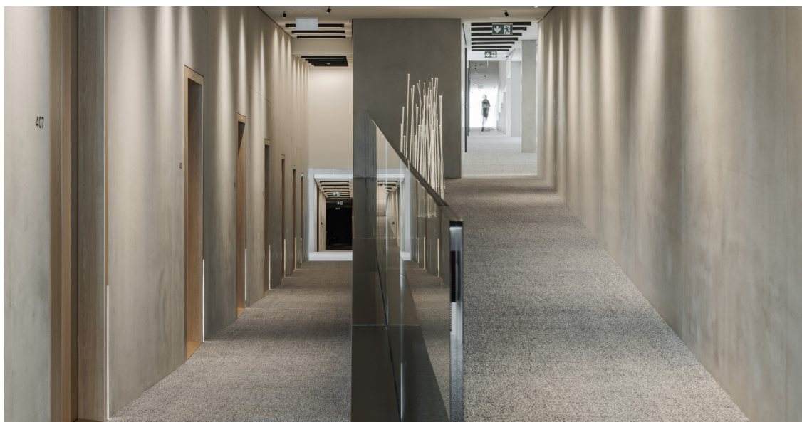
▲ Un couloir intérieur suit la structure en zigzags du bâtiment conçu par BIG et connecte les différentes chambres.

Cette création architecturale est la seconde conçue par BIG dans le petit village du Brassus. Le groupe a déjà signé la spirale en verre ultra-contemporaine du Musée Atelier Audemars Piguet, inauguré en 2020, et pour laquelle ils ont été récompensés par 9 prix dont celui du Best Architecture Award délivré par l'American Institut of Architects (AIA) le 12 janvier 2021.