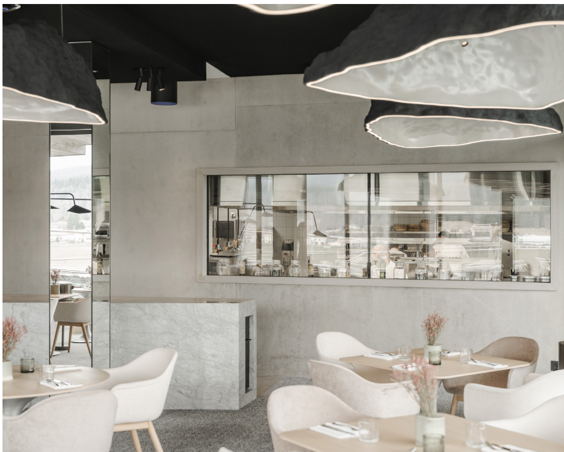
▲ Signé par le chef étoilé Emmanuel Renaut, le restaurant Le Gogant présente une carte du terroir raffinée dans une atmosphère chaleureuse à l'image de la Vallée.

Enfin, juste derrière le Gogant, un espace intimiste abrite la Table des Horlogers qui propose une cuisine gastronomique servie autour d'une seule table pouvant accueillir jusqu'à 12 personnes pour une expérience des plus conviviales. Un menu dégustation y est servi tous les jours de la semaine, offrant une véritable exploration des sens.