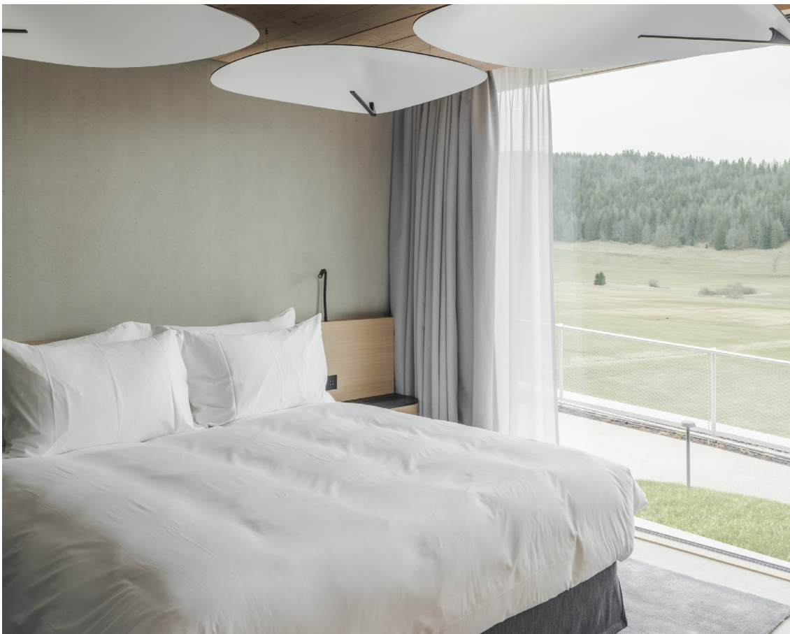
▲ Les 50 chambres marient revêtements en épicea, larges baies vitrées et béton lisse pour une touche contemporaine, chaleureuse et raffinée.