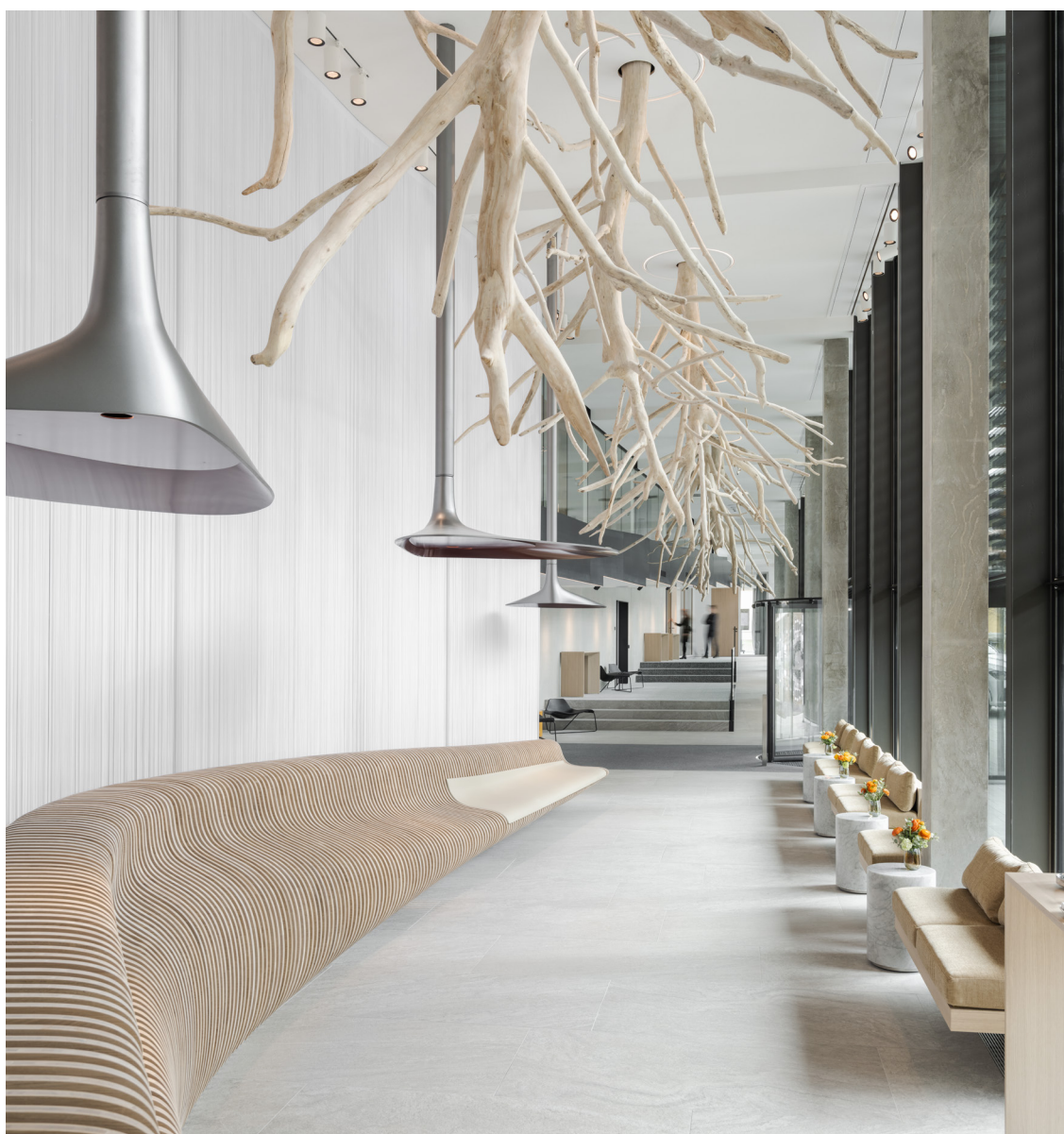
▲ La décoration d'intérieur imaginée par l'agence d'architecture AUM rend hommage aux paysages de la vallée de Joux en mettant à l'honneur des matériaux locaux tels le bois et la pierre.