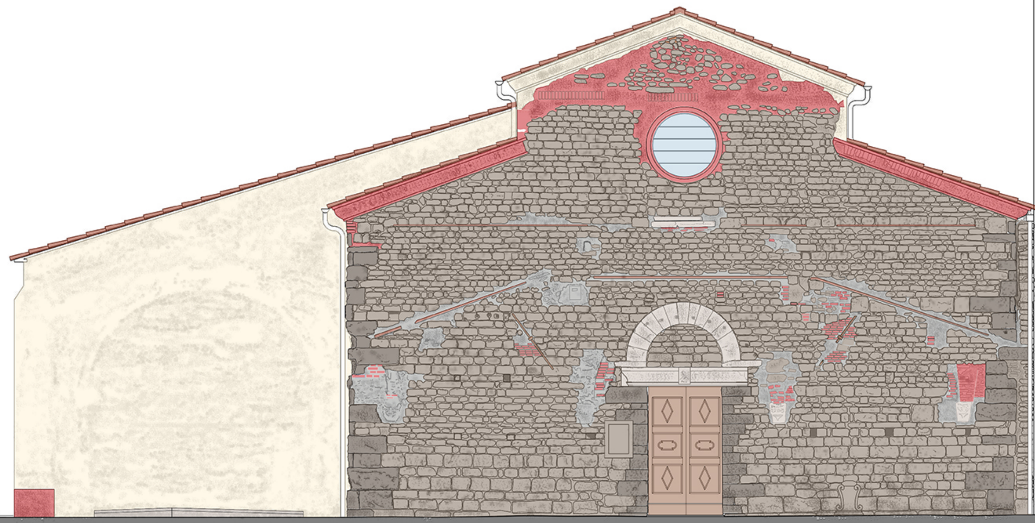
PROSPETTO OVEST | MATERIALI