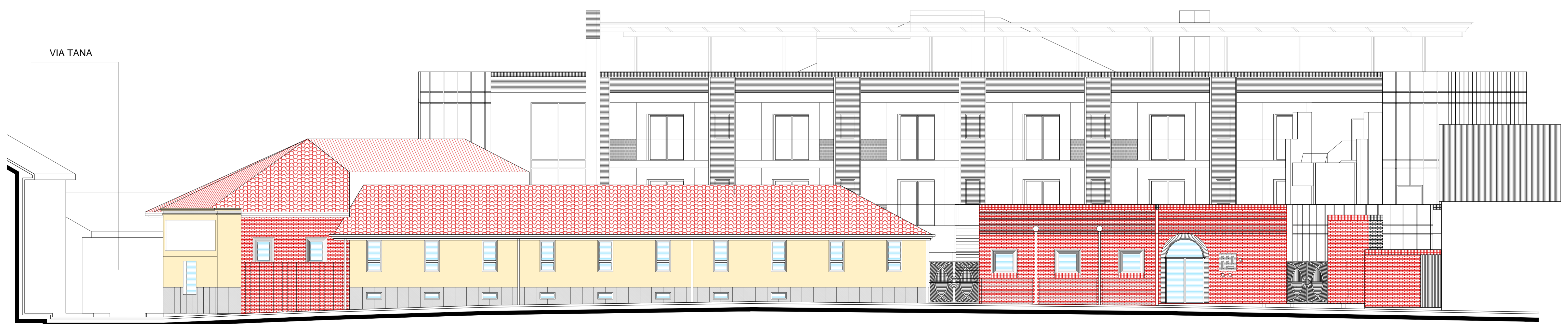
PROSPETTO SU VIA DEL GUALDO