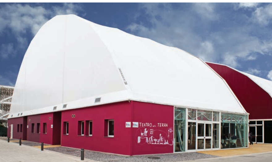
Teatro della Terra - P 35000mm L 15000mm h 14000mm, 525 m 2 .