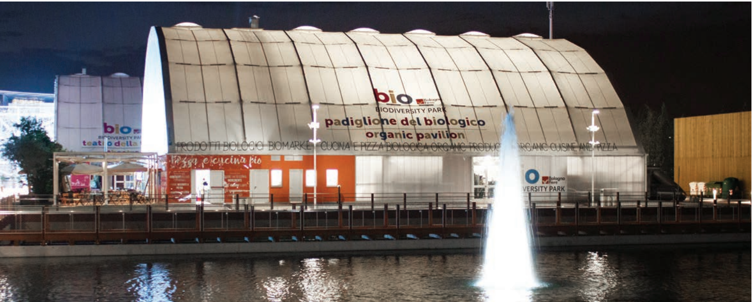
Padiglione del Biologico - P 35000mm L 35000mm h 14000mm, 1225 m 2 .

Le coperture Koproon S.p.A. vestono un'area di 3.000 m 2 , sono ad arco, in acciaio zincato a caldo e ricoperte con vernice intumescente. Il telo di copertura bianco in PVC, autoestinguente in classe 1, si alterna al policarbonato a sette camere nel rivestimento delle facciate. L'ancoraggio a terra della struttura è fatto con la tecnica della tassellatura con ancorante chimico. Le strutture sono dotate di lucernari automatici per facilitare la ventilazione naturale e ridurre l'impianto di condizionamento nei periodi intermedi.