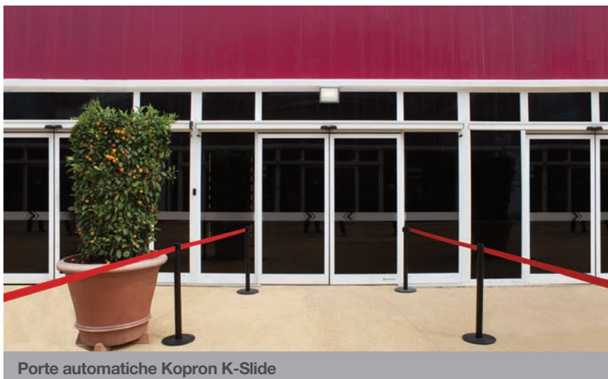
Porte automatiche Kopron K-Slide