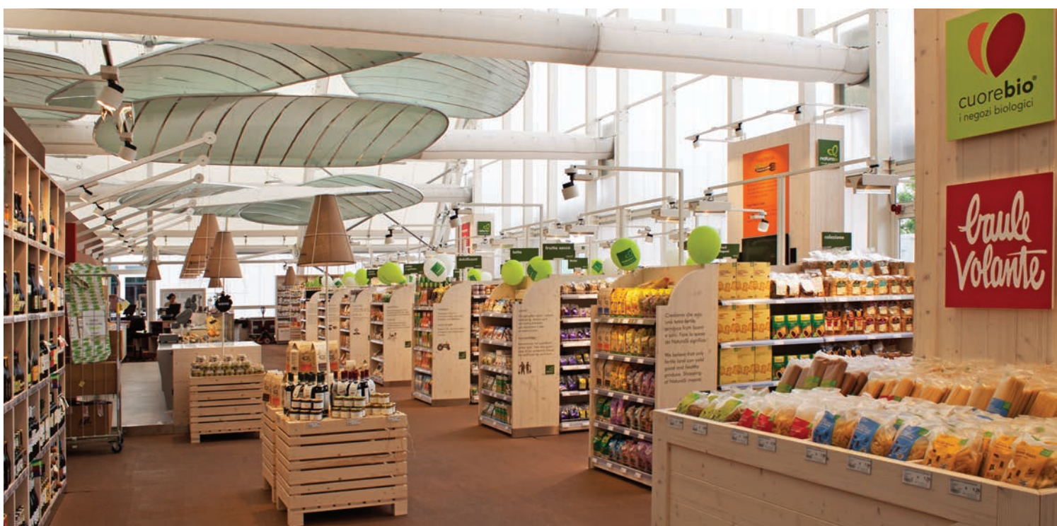
Possibilità di curare e personalizzare gli allestimenti