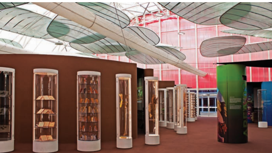
Mostra della Biodiversità - P 35000mm L 35000mm h 14000mm, 1225 m 2 .