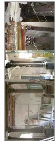
Columnas corintias en madera.