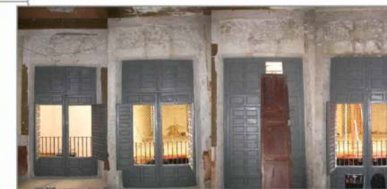
Yeserías puertas jónicas desmontadas