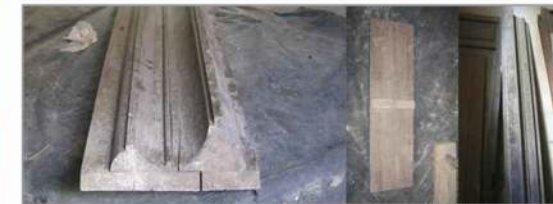
Zócalo de madera