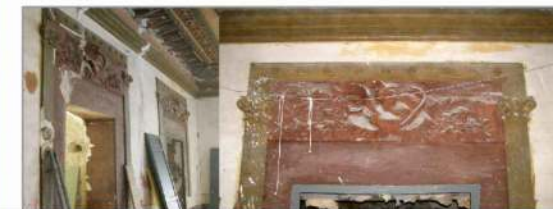
Yeserías puertas jónicas conservadas