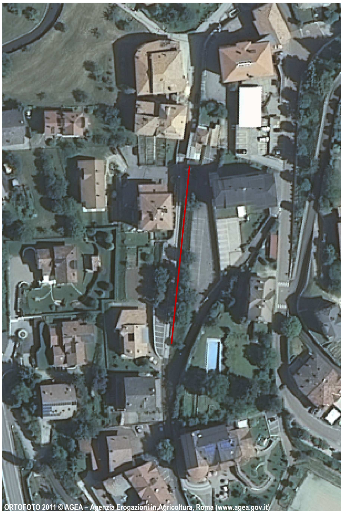
ORTOFOTO 2011