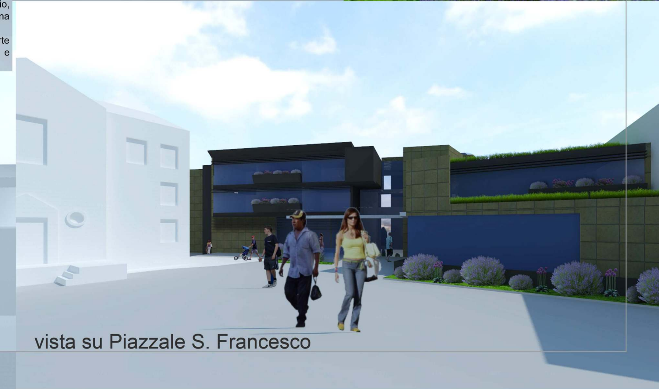
vista su Piazzale S. Francesco