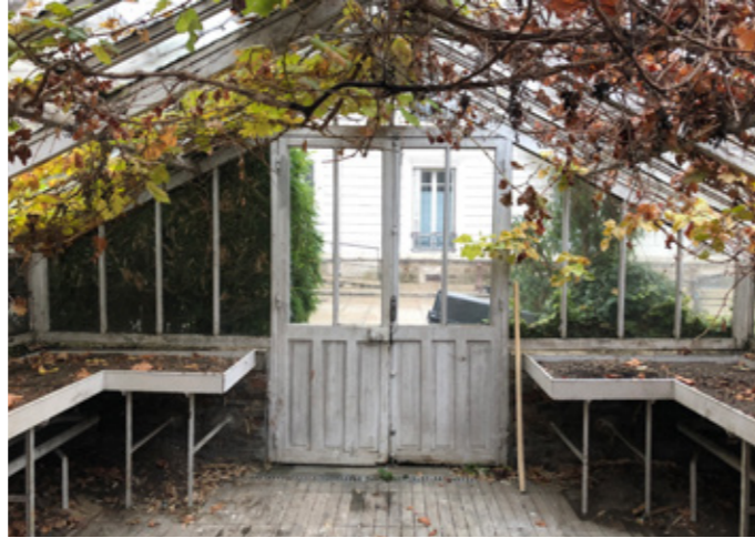
Intérieur de la serre avant intervention

Afin d'adapter la serre à sa nouvelle destination, il a d'abord été nécessaire d'abaisser le niveau du sol. D'une part, car la hauteur initiale n'était pas suffisante, d'autre part, car il était impossible de surélever le volume. Afin de distinguer l'existant du projet, il a été décidé de jouer sur les matérialités, en marquant les surfaces situées au-dessous du niveau initial par du terrazzo, et celles localisées au-dessus par du bois, matériau qui couvrirait l'ancien sol. De cette manière, l'équipement raconte l'histoire de la construction et témoigne de ses usages passés. Pour ce faire, les murs périphériques en briques de terre cuite ont été repris en sous-œuvre à l'aide de briques réemployées et couverts d'un rejingot en béton coulé sur place. De son côté, la verrière a été refaite à l'identique. La collaboration avec l'entreprise Aubert Labansat en charge de l'ouvrage, a permis de s'approcher des sections de bois initiales, tout en intégrant un double vitrage, pour améliorer les performances thermiques. Le volume intérieur a donc été modifié sans pour autant impacter l'enveloppe du bâtiment.