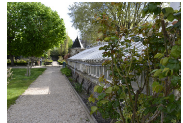
Extérieur de la serre avant intervention

Une opération conduite main dans la main avec les bureaux d'études et les entreprises certifiées "Monument historique", notamment H Chevalier, Aubert Labensat ou encore Golfe agencement, dont l'expérience et les savoir-faire ont nourri le projet et contribué à sa réussite.