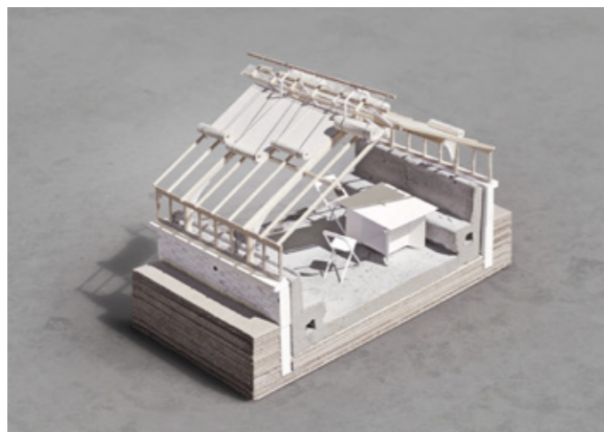
Photographie maquette coupe