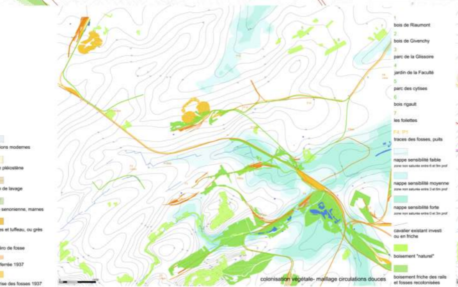
colonisation végétale - maillage circulations douces