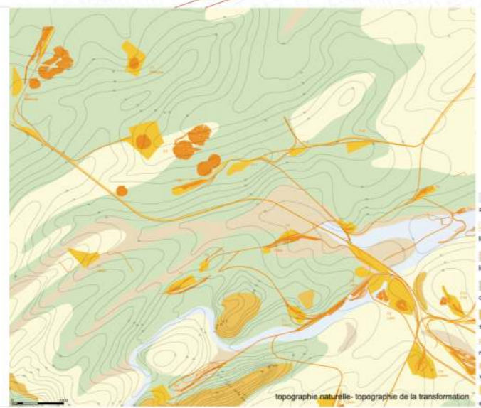
topographie naturelle - topographie de la transformation