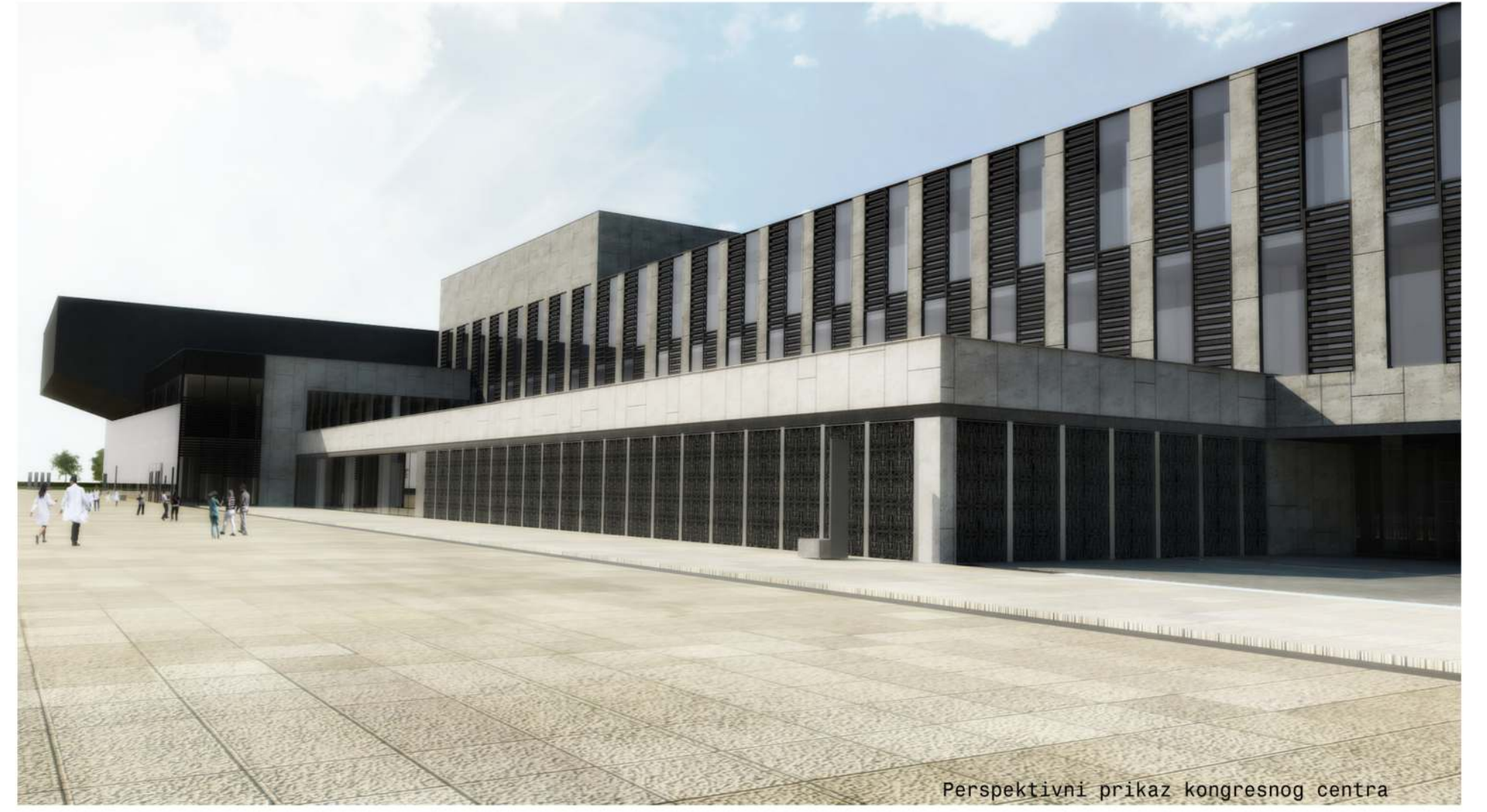
Perspektivni prikaz kongresnog centra

Kompleks sadrži objekte medicinske namene, akademski, kongresni i sportski centar, kao i objekte logističkog centra i tehnološkog bloka. investitor: GP PLANUM AD projektant: MašinoProjekt KOPRING autor: Miroslav D. Stefanović godina projektovanja: 2012-2014 površina parcele: 50 ha površina objekta: 195.000,00 m 2 (ukupno 33 objekta)