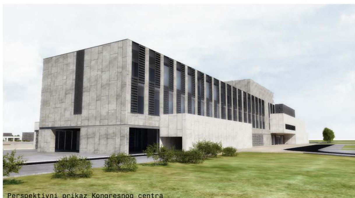
Perspektivni prikaz Kongresnog centra