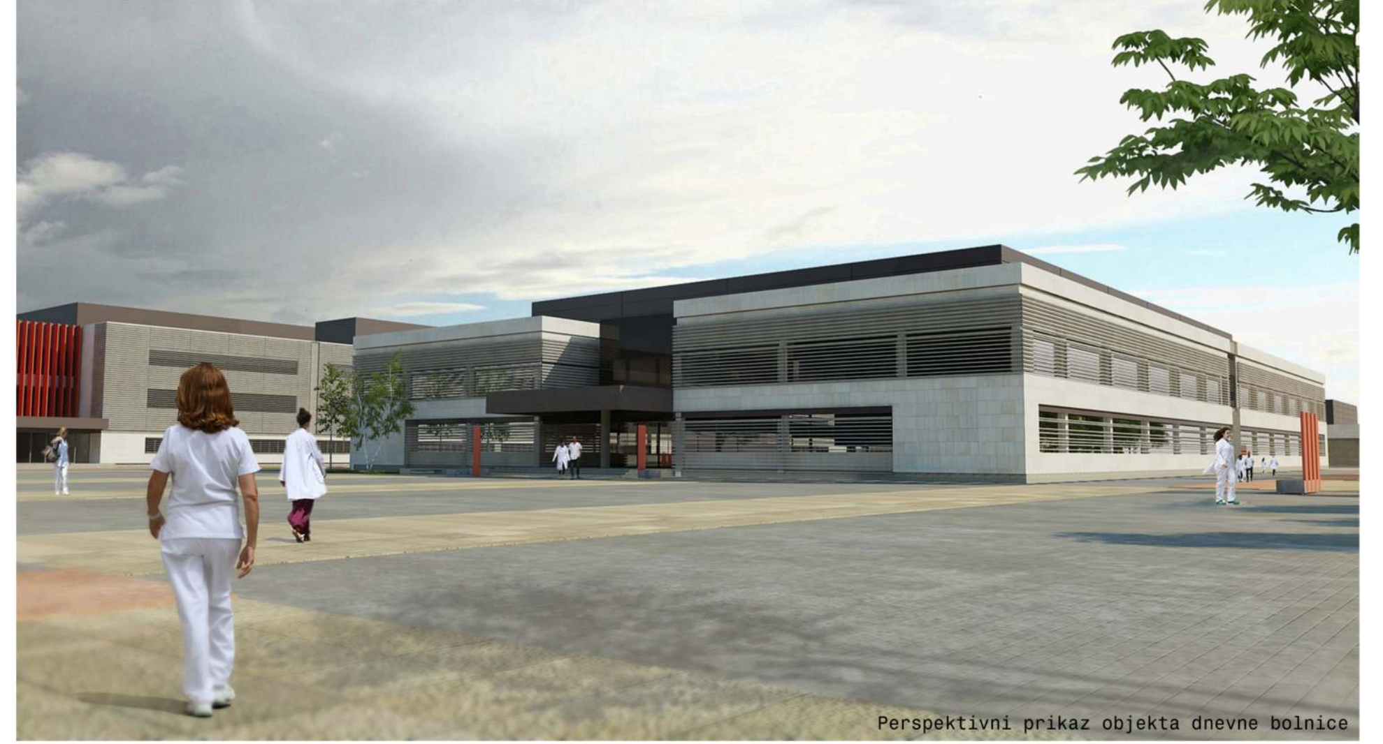
Perspektivni prikaz objekta dnevne bolnice