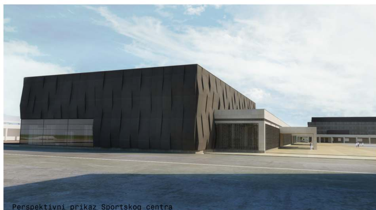
Perspektivni prikaz Sportskog centra

Atrijumski prostori u objektima su nadkriveni - kupole, odnosno pokrivač atrijuma projektovan je kao "mreža" različitih paterna utkanih u translucentnu tavanicu, koja propušta difuznu magičnu svetlost u duhu lokalne arhitekture.