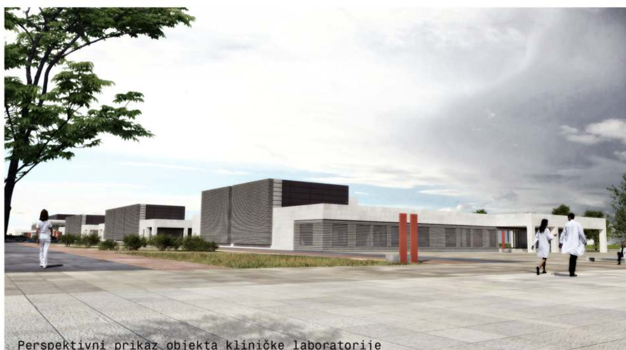
Perspektivni prikaz objekta kliničke laboratorije