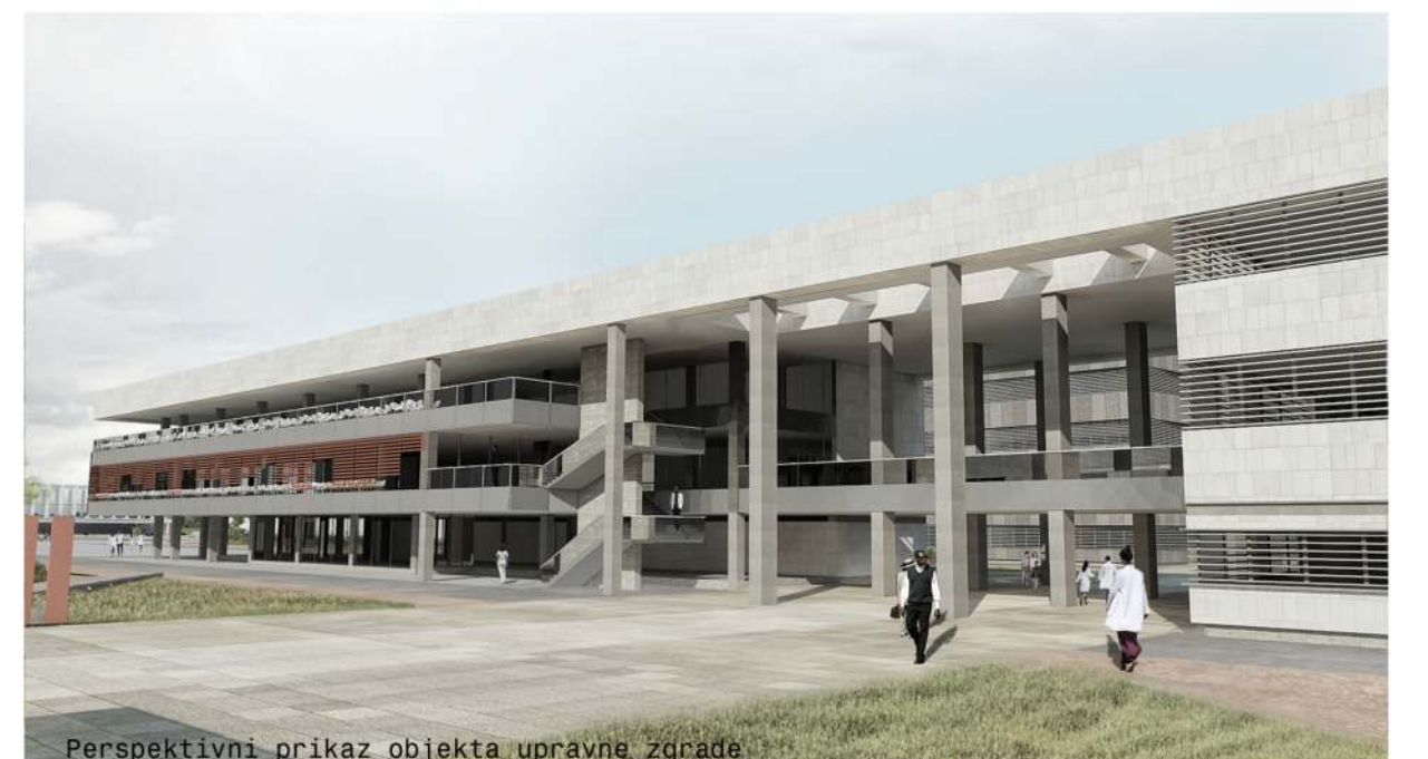
Perspektivni prikaz objekta upravne zgrade