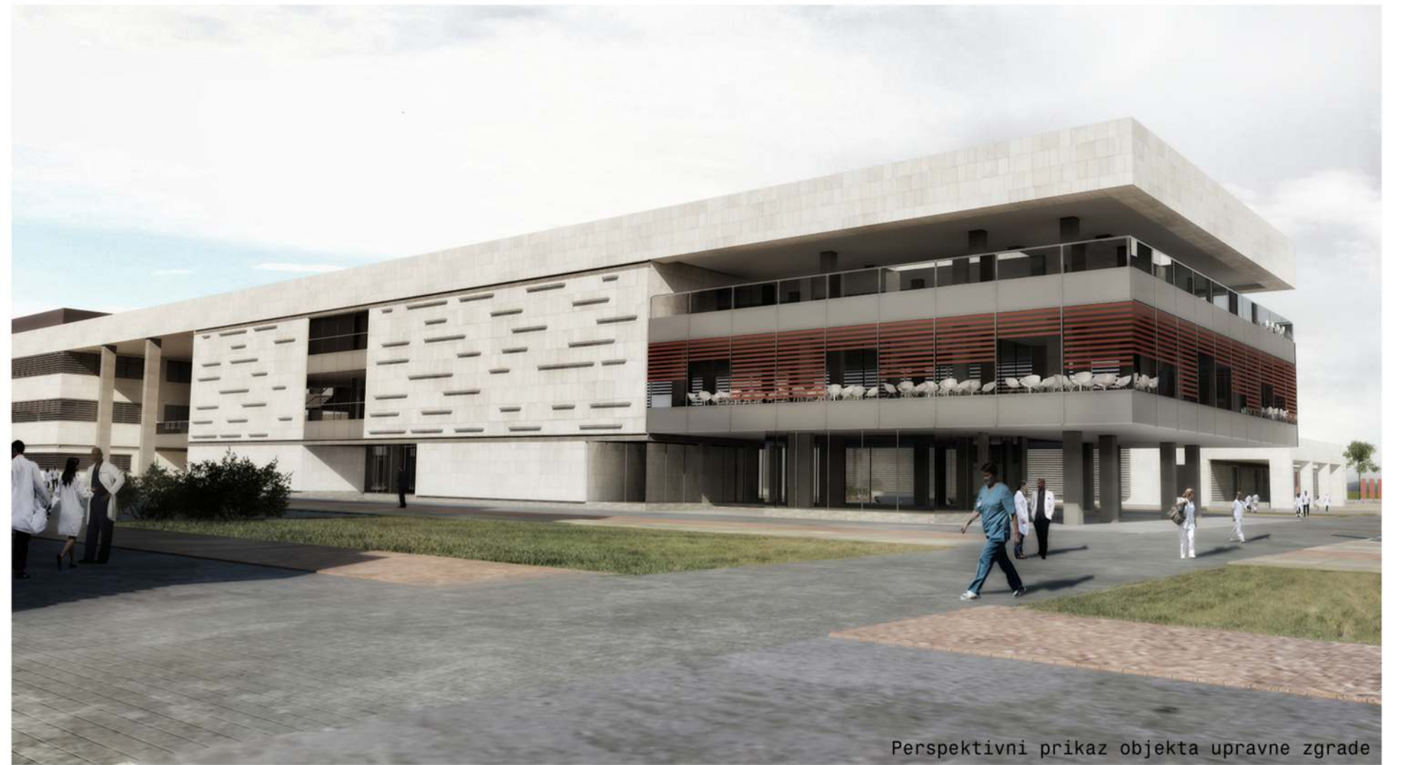
Perspektivni prikaz objekta upravne zgrade