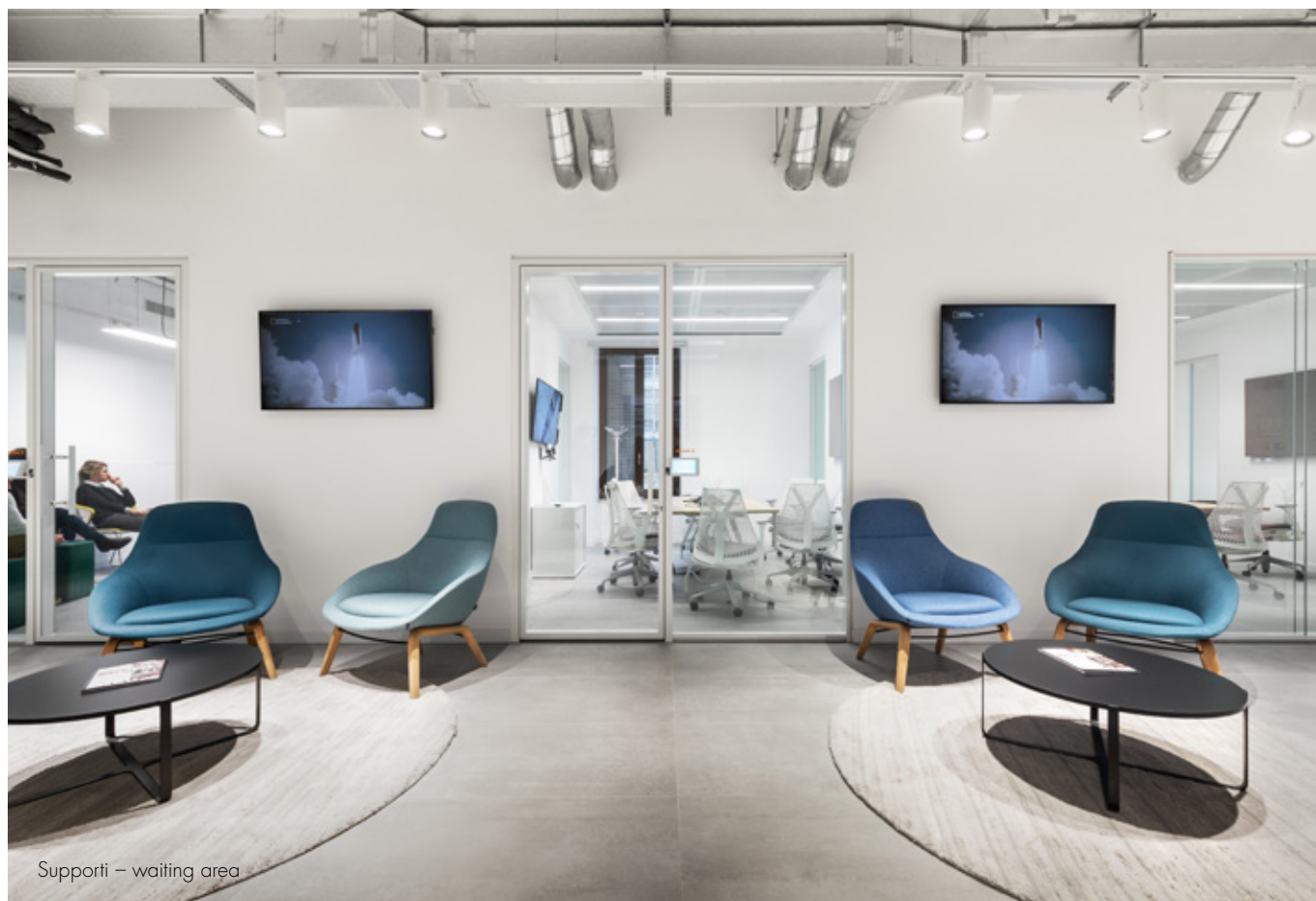
Supporti – waiting area

Come nella città, Gallery e Lighthouse sono i servizi ai quartieri, e questi sono i Neighborhood , l'open space improntato all'efficienza e al comfort. Anch'esso non è indifferenziato e comprende al suo interno una porzione dedicata allo scambio creativo. Infine Monument corrisponde ai nuclei dei corpi scala e ascensori, i quali diventano Landmark d'orientamento nello spazio, sempre riconoscibili nella grafica alle pareti e nei monitor digitali per la comunicazione.