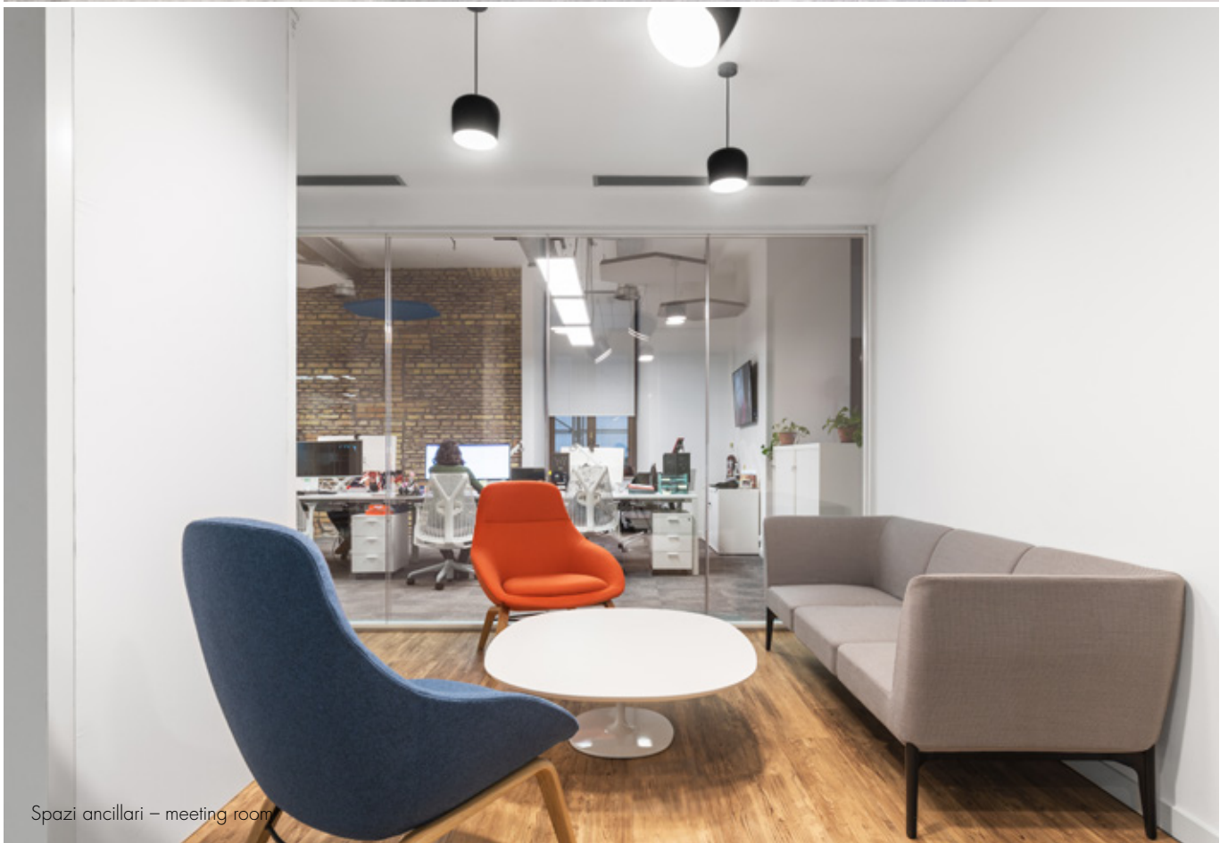
Spazi ancillari – meeting room