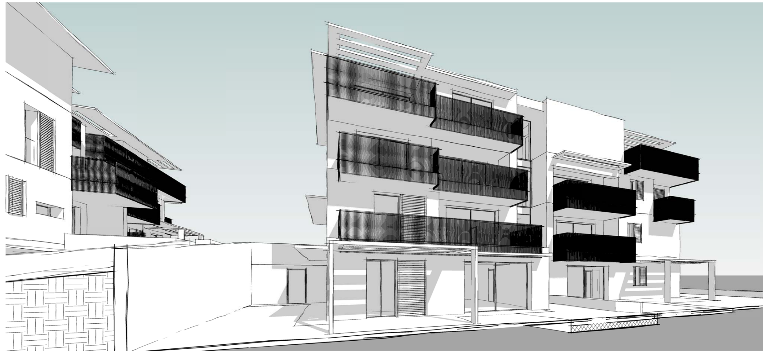
Vista 3D Scala