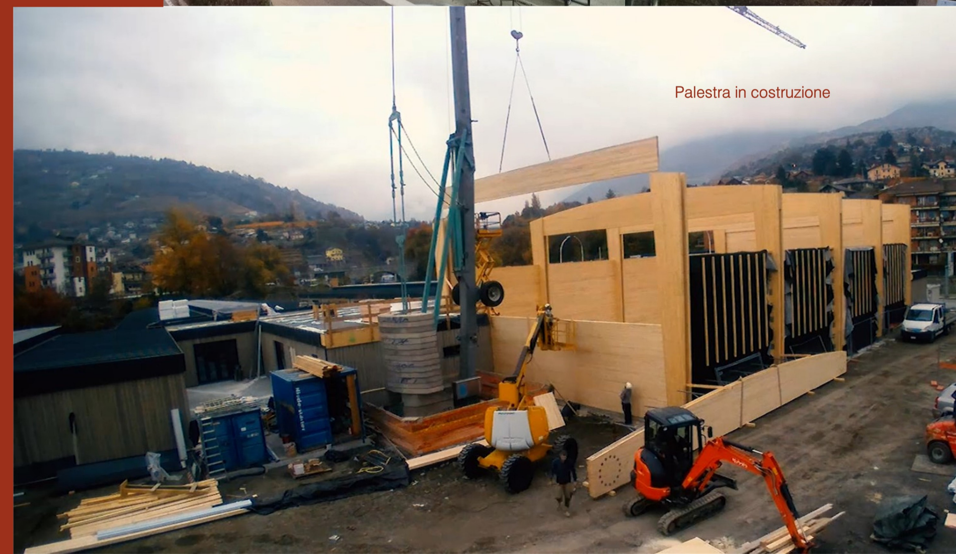
Palestra in costruzione

Nel corso del mese di novembre sono state inoltre completate le sistemazioni esterne, comprensive di modifiche della viabilità, parcheggi, pavimentazioni, arredi esterni, e realizzato un archivio non inizialmente previsto.