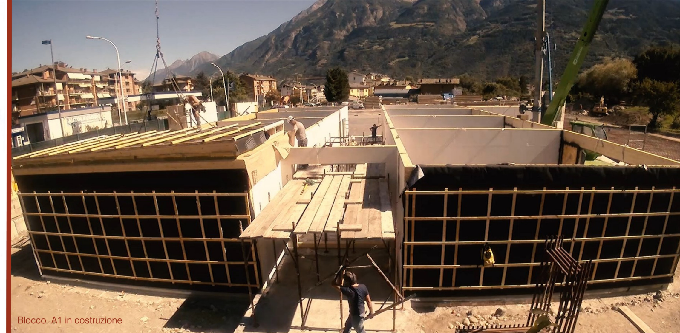
Blocco A1 in costruzione