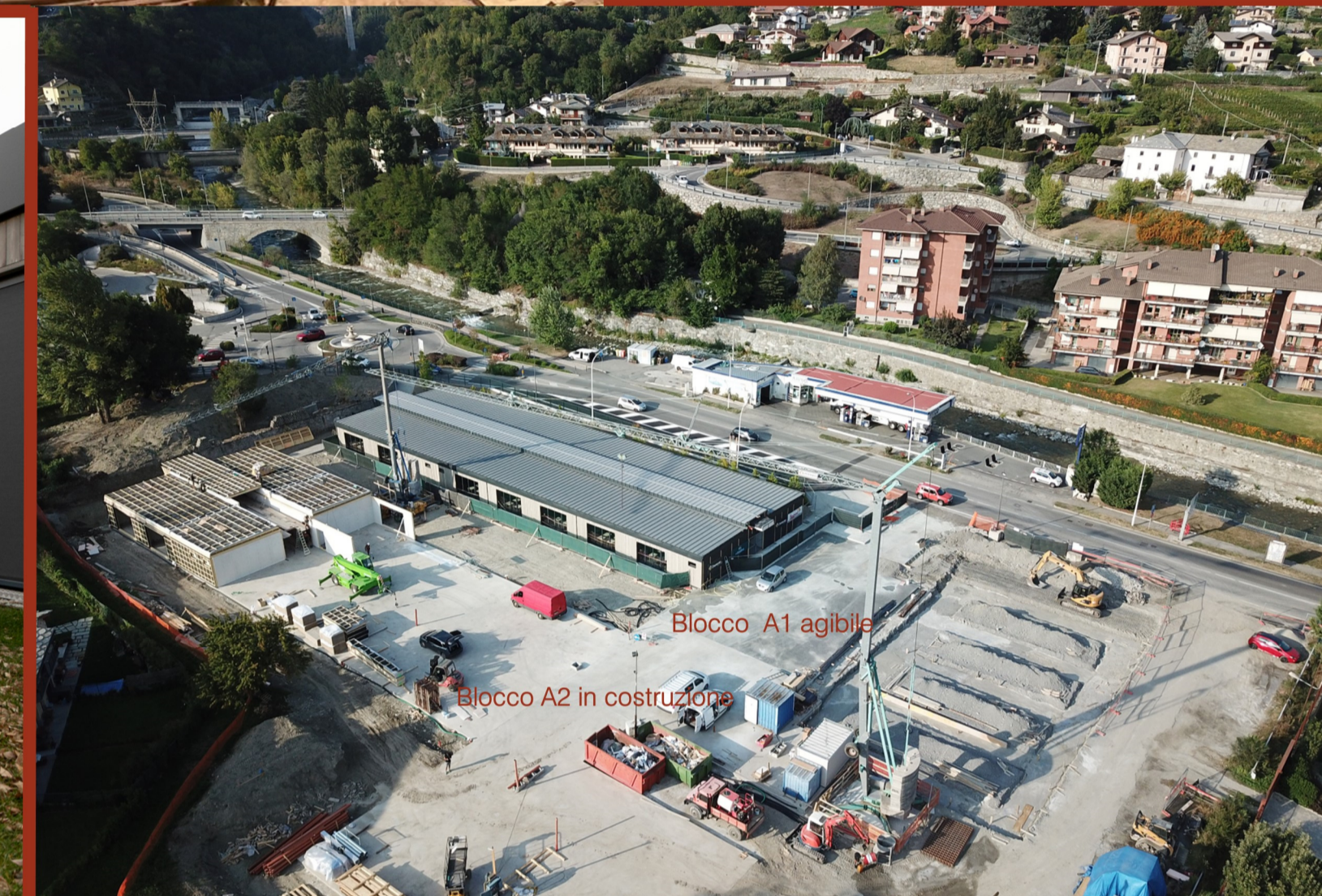
Blocco A1 agibile