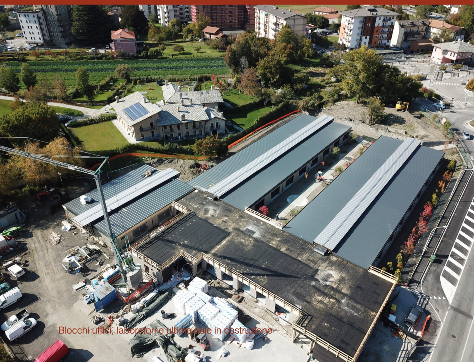
Blocchi uffici, laboratori e ultime aule in costruzione

Venivano inoltre completate le sistemazioni esterne nelle aree circostanti le aule dei blocchi A1 e A2, con anche arredi, inerbimento e piantumazioni.