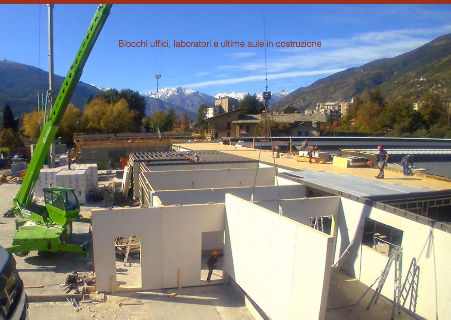
Blocchi uffici, laboratori e ultime aule in costruzione