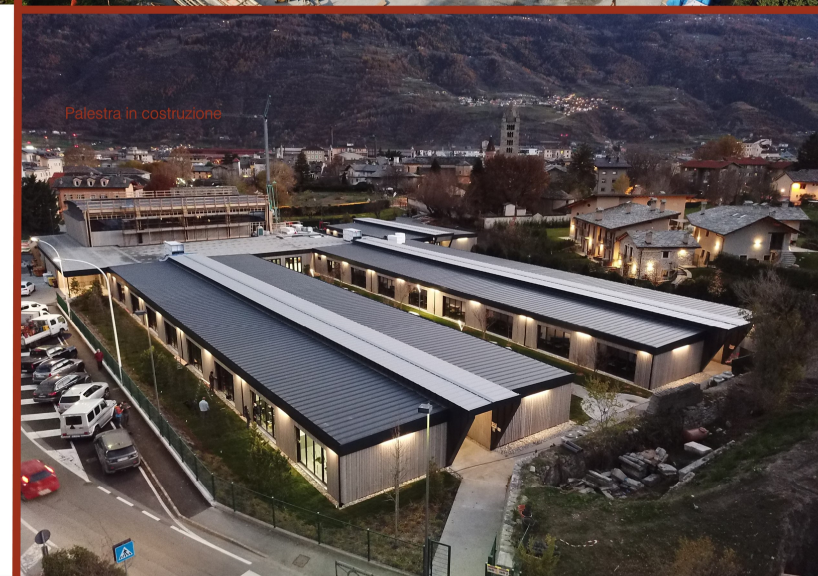
Palestra in costruzione