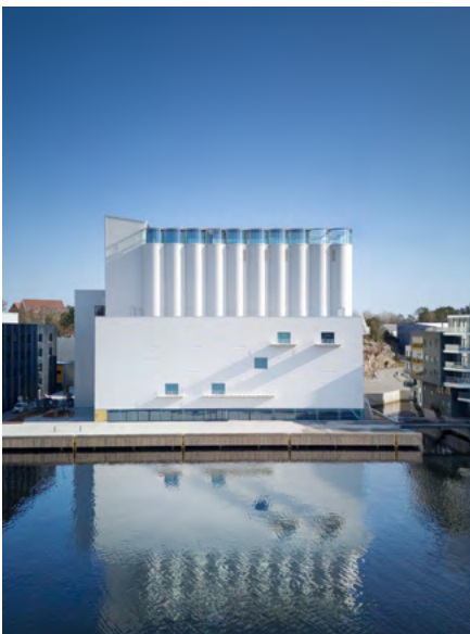
Museo Kunstsilo, Noruega

En relación con el proyecto de DCB Montana, sirvan de ejemplo de dicha premisa, otras tres de sus más recientes obras, el Museo Kunstsilo, en Kristiansand (Noruega) –diseñado en junto con los estudios Mendoza Partida y Mestres Wåge–, el espacio de innovación, arte y diseño Center Rog, en Liubliana (Eslovenia) –diseñado junto con Mendoza Partida–, y el museo Yancuic en Iztapalapa (México), diseñado junto con Mendoza Partida y SPRB arquitectos.