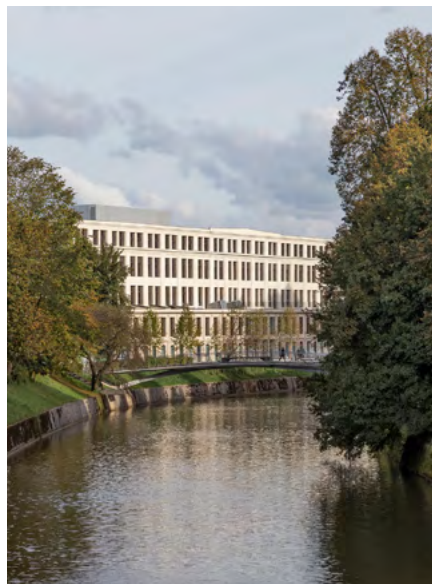
Center Rog, Eslovenia