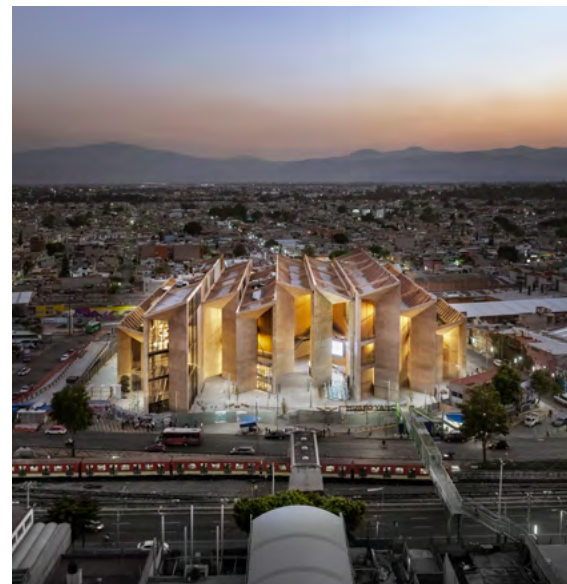
Museo Yancuic, México