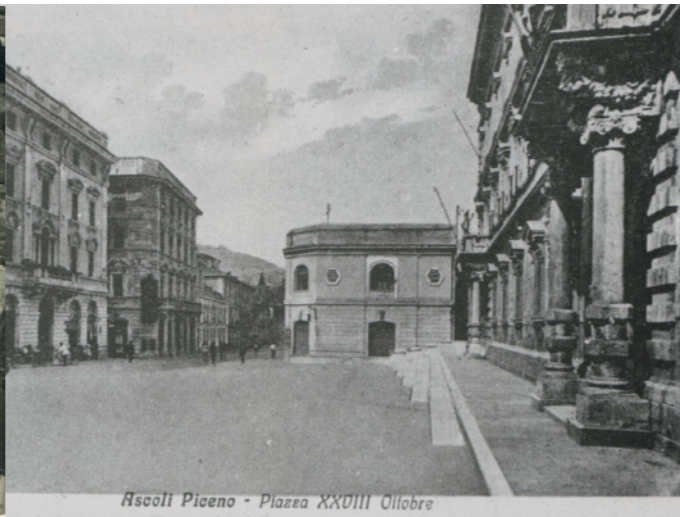
Ascoli Piceno - Piazza XXVIII Ottobre