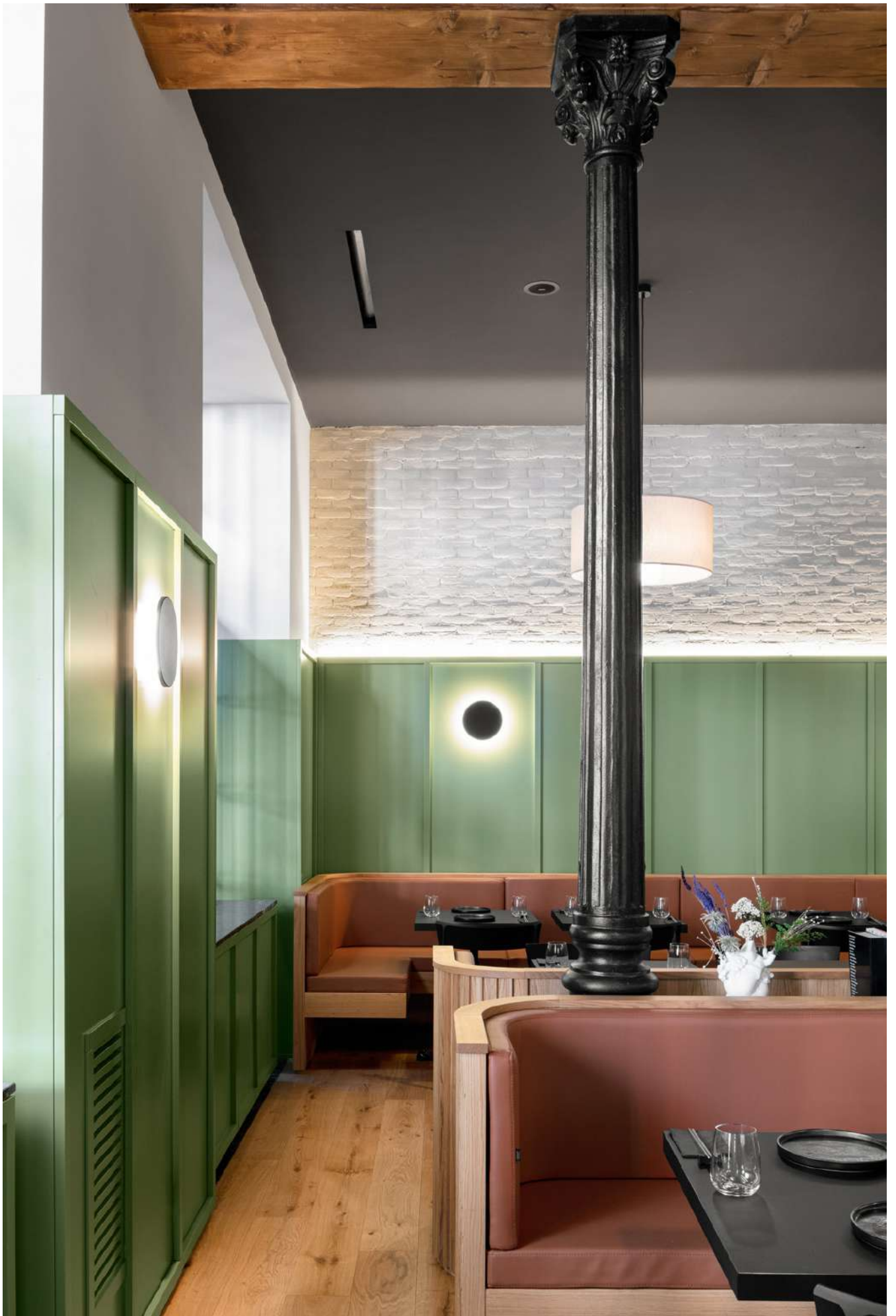
FADD Architects, Napoli