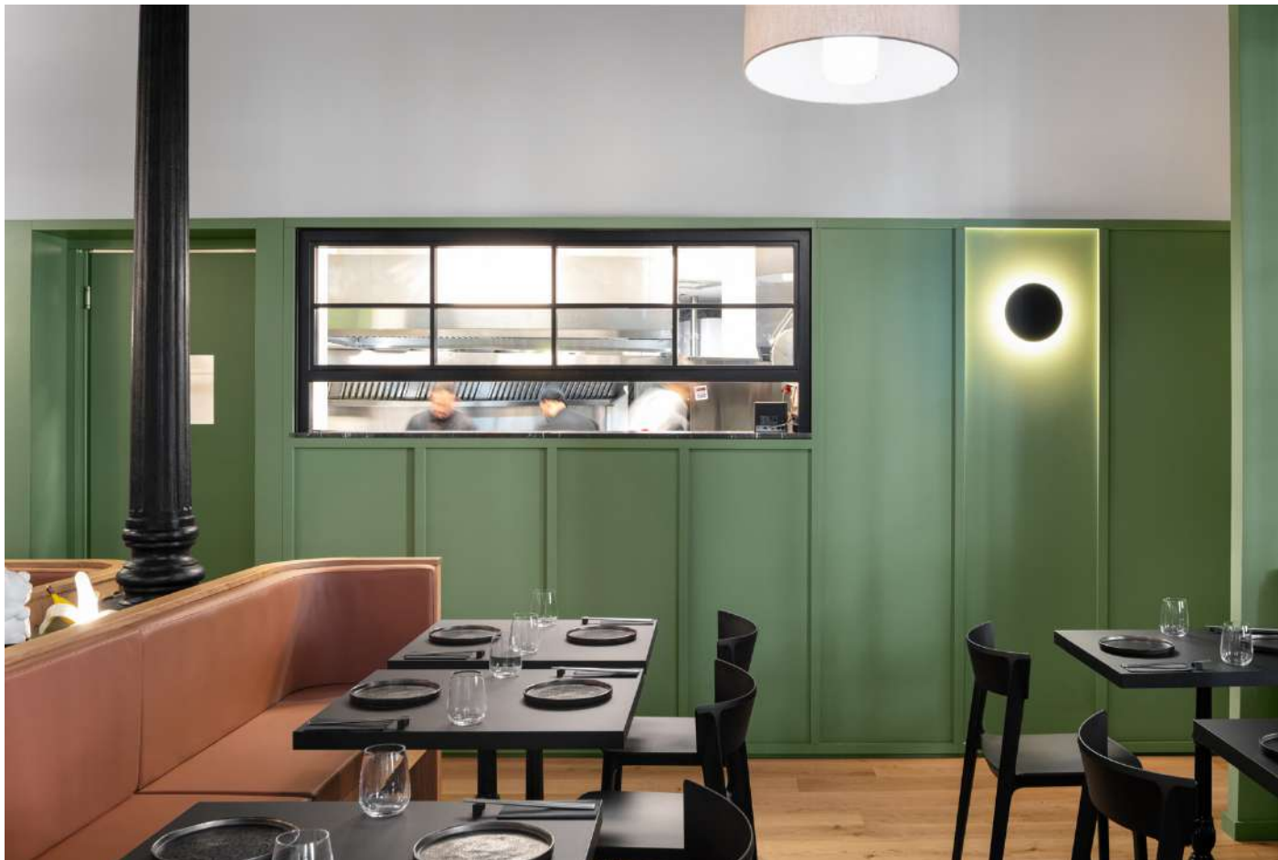
FADD Architects, Napoli