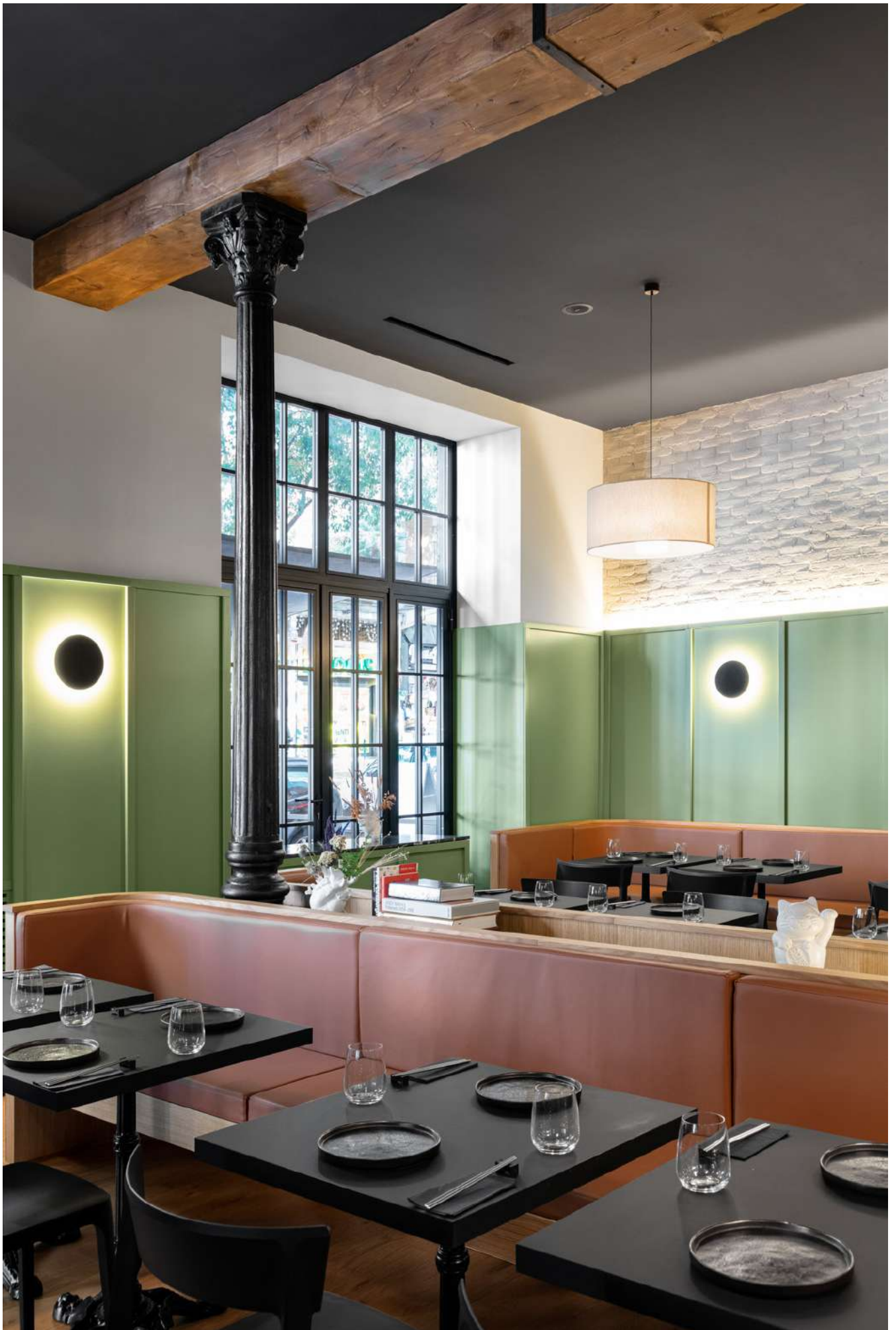
FADD Architects, Napoli