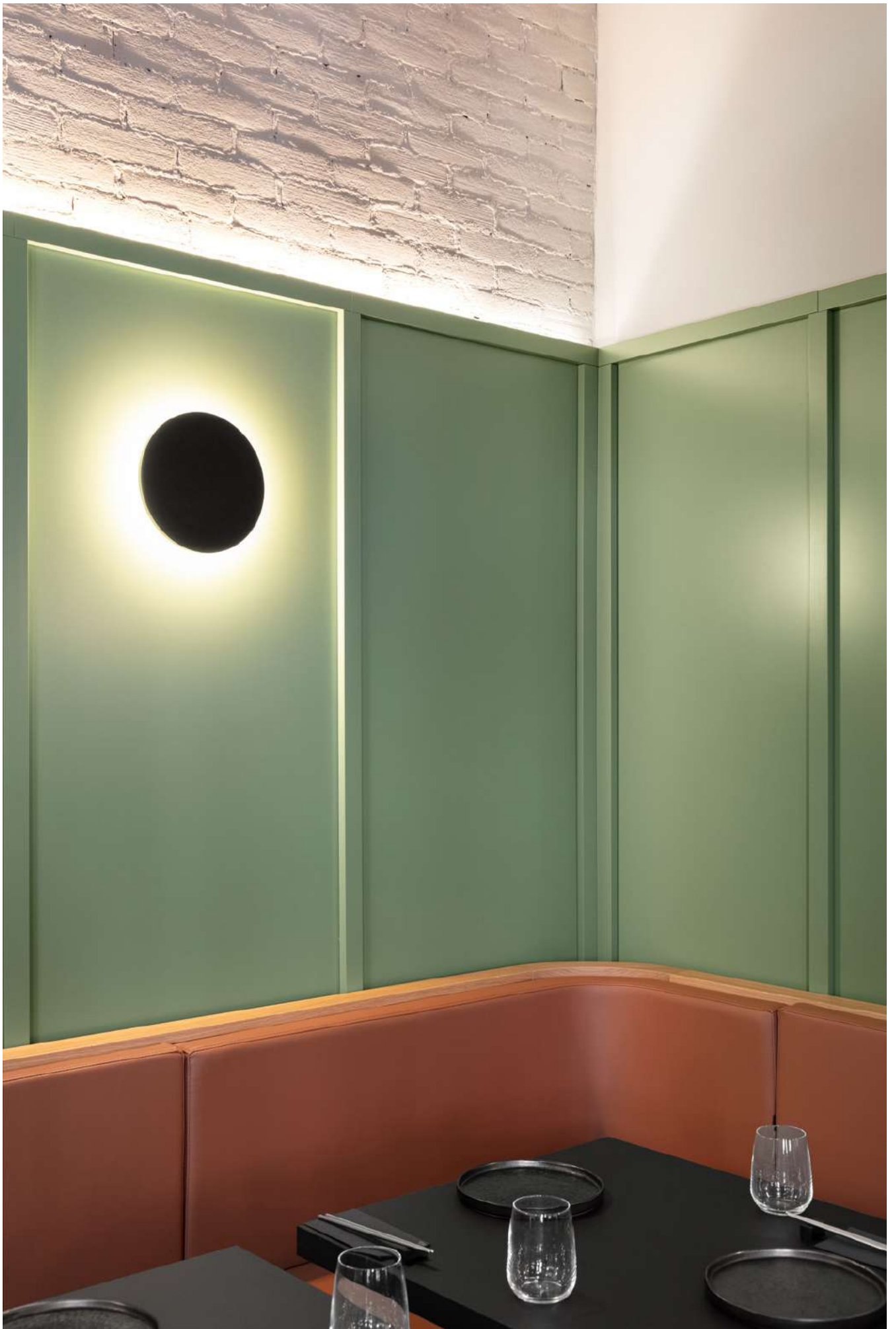
FADD Architects, Napoli