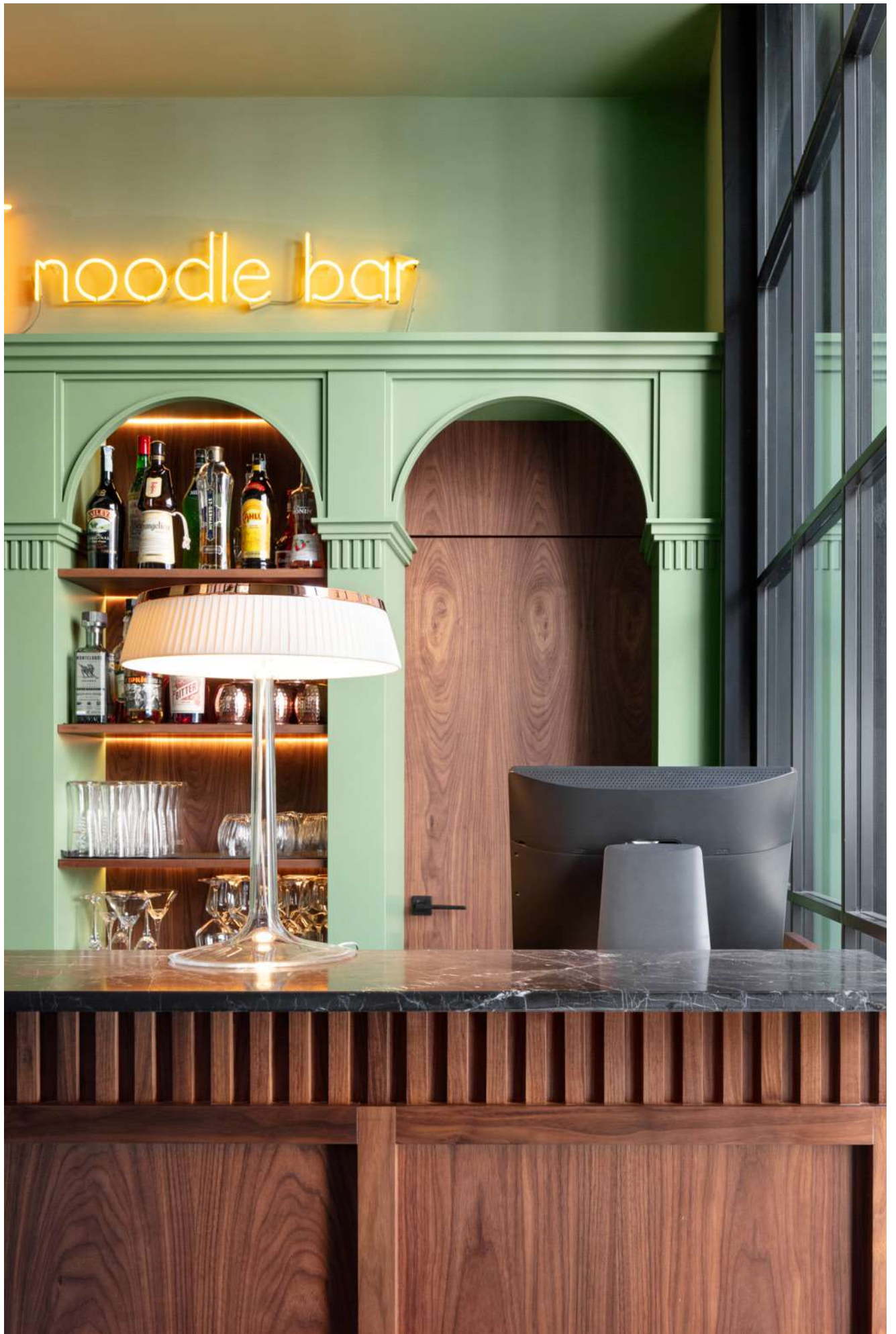
FADD Architects, Napoli