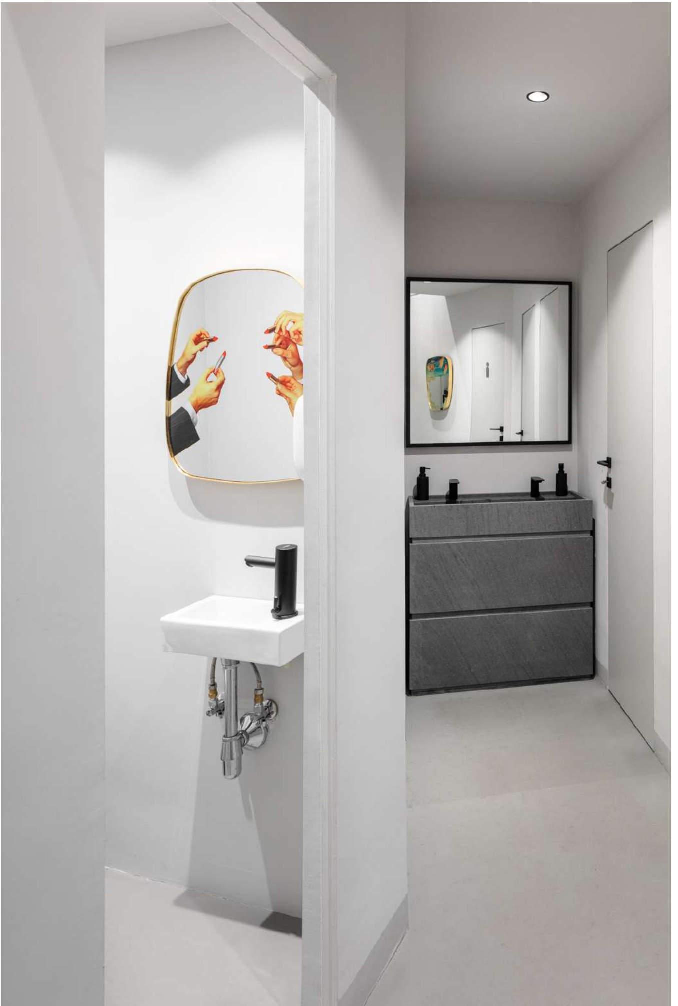
FADD Architects, Napoli