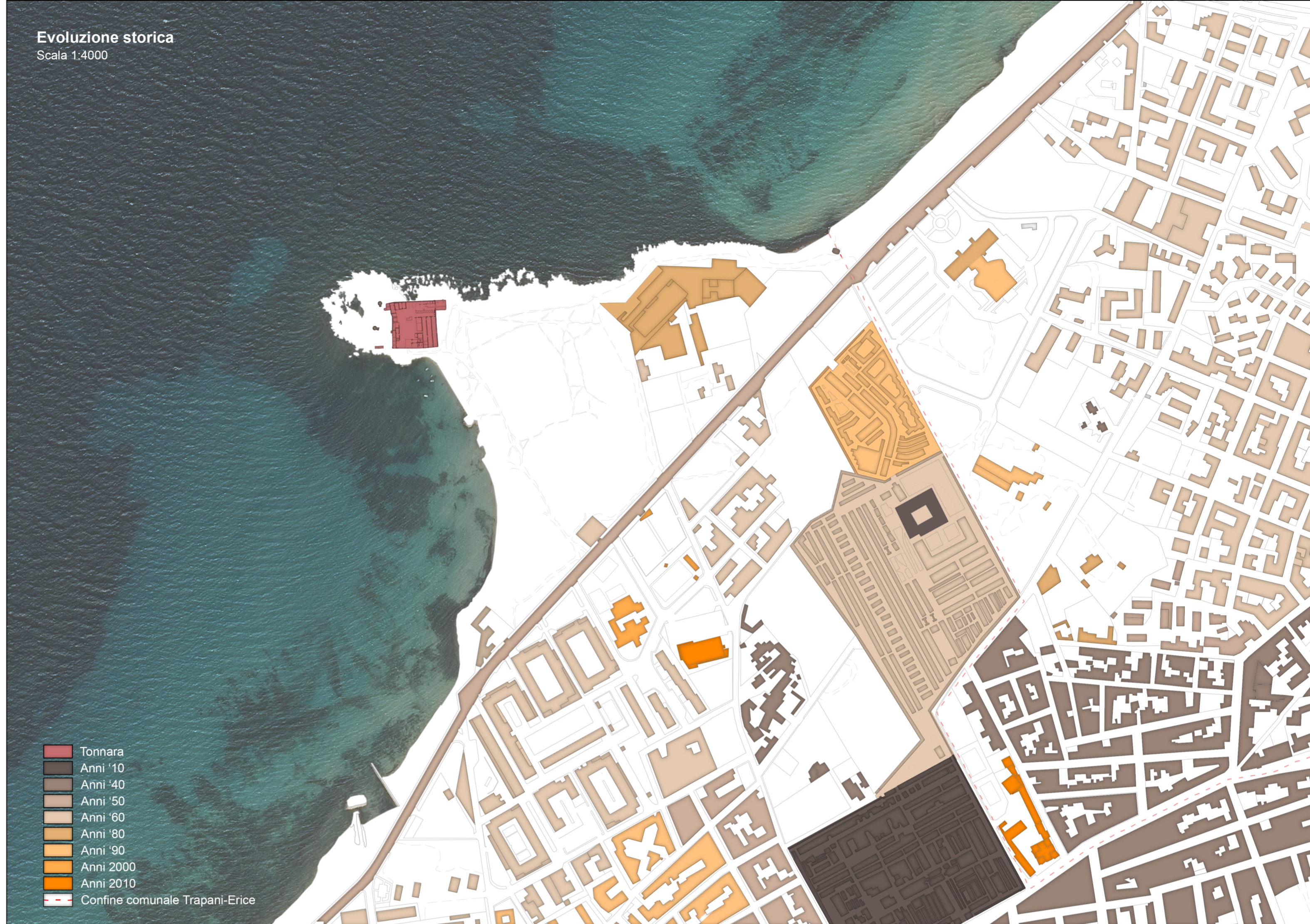
Evoluzione storica Scala 1:4000