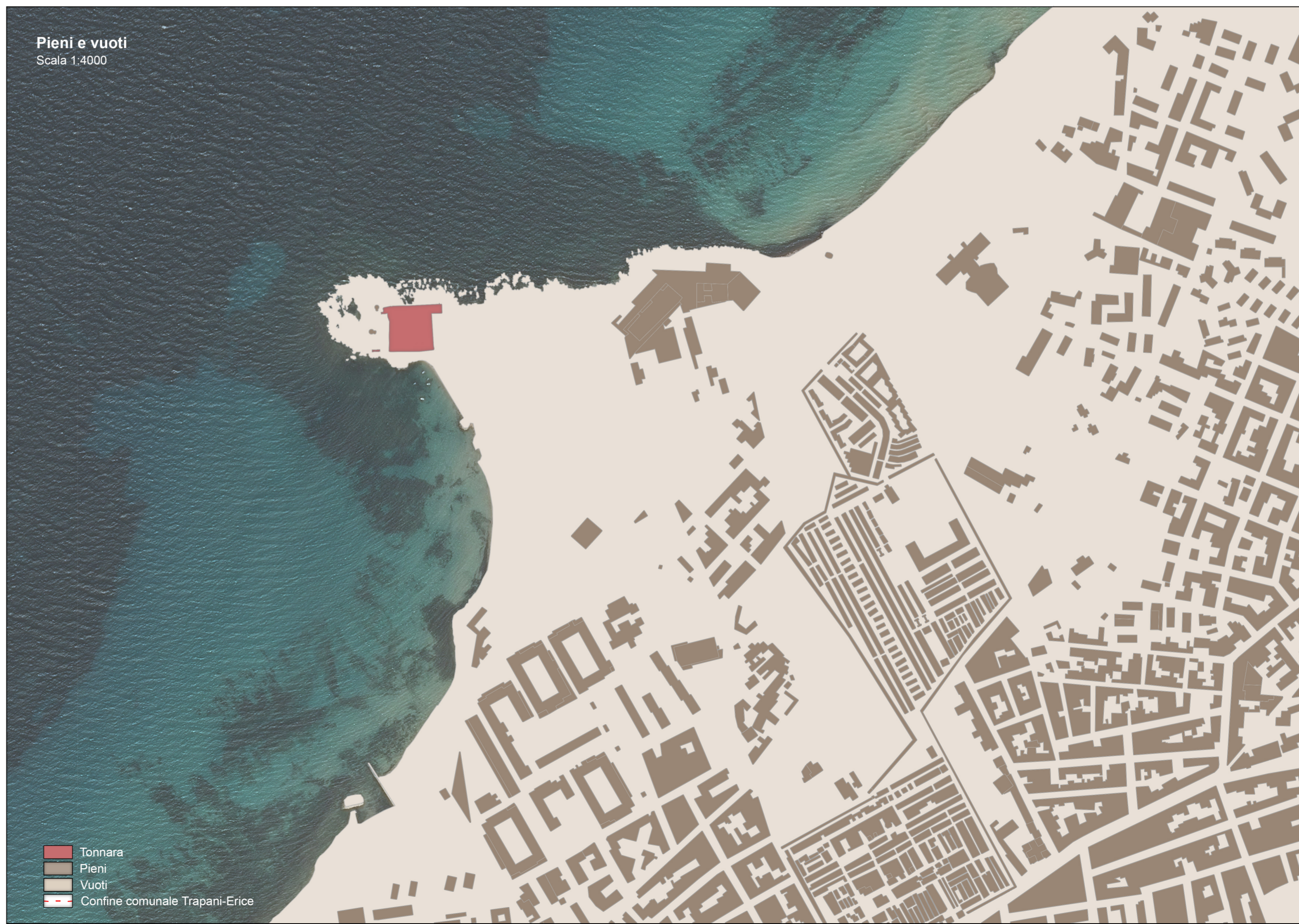
Pieni e vuoti Scala 1:4000