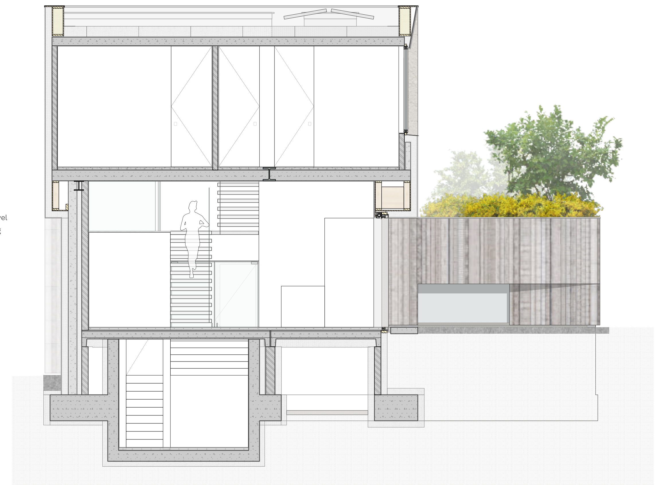
2 DOORSNEDE 34 1:50 301