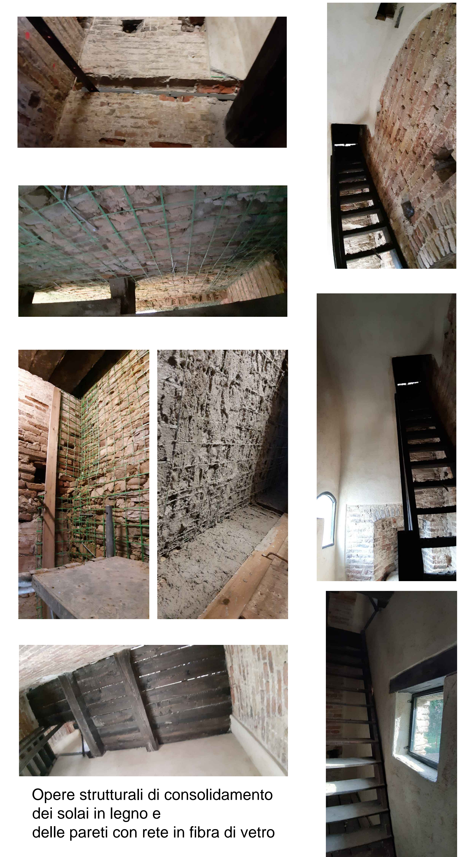
Opere strutturali di consolidamento dei solai in legno e delle pareti con rete in fibra di vetro