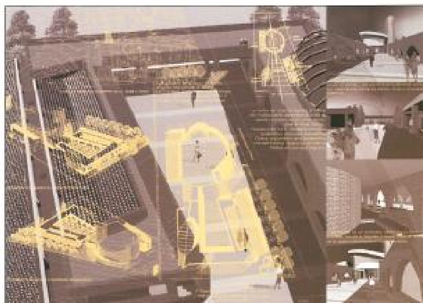
Tavola di progetto. Diversi disegni prospettici che mostrano il progetto del sagrato uno spazio che ricorrendo naturalmente verso il centro del luogo celebrativo. Sulla destra, le arcate dei porticati.

Una chiesa di recente fattura, con una copertura che declina verso il lato nel quale si erge il campanile segno significativo che individua la facciata. Il sagrato è qui concepito, esaltando la configurazione del terreno antistante la chiesa, come il luogo incontro entro rette convergenti in un punto, all'interno della chiesa. In tal modo, al di là della facciata, si individua il luogo dell'altare e la relazione tra sagrato e spazio liturgico si fa immediata. Affiancato da due porticati, il sagrato si configura come spazio aperto ma ben protetto e attrezzato. Spiega di camosciale visivo che porta a indovinare il fulcro dell'azione liturgica e allo stesso tempo luogo che si presta alle diverse attività di carattere parrocchiale. Sul lato sinistro del porticato emerge il volume a pianta ellittica della sala polivalente, coperta da un tetto a forma di carena rovesciata. Il porticato sul lato destro dà accesso alle diverse sale per i servizi parrocchiali e ad alcune aree verdi di pertinenza delle aule. Il sagrato è attraversato da gradini paralleli tra loro, posti trasversalmente al percorso assiale di avvicinamento alla chiesa. In tal modo lo spazio risulta intonato sia sui lati, dalle arcate, sia orizzontalmente. □