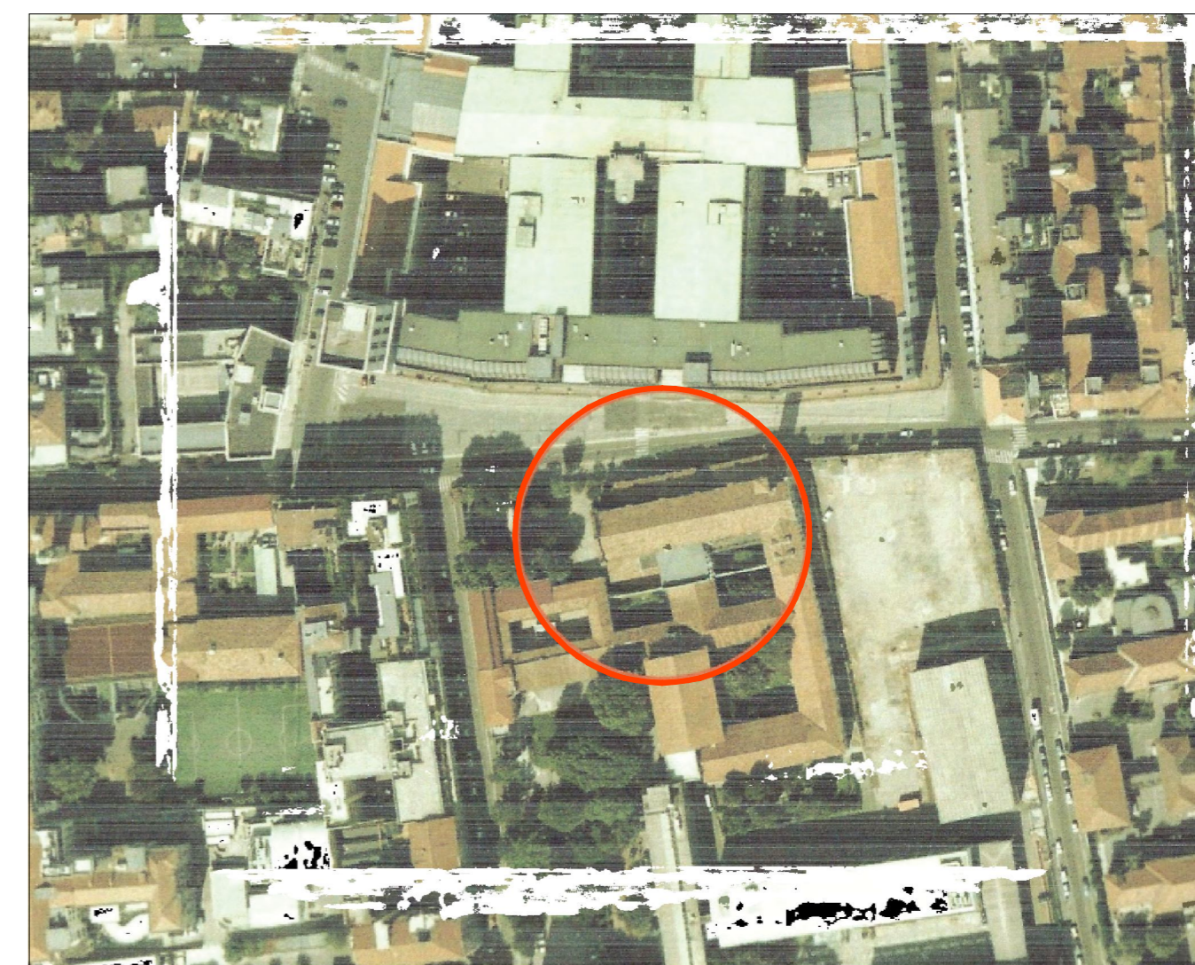
estratto fotogrammetrico scala 1:2000