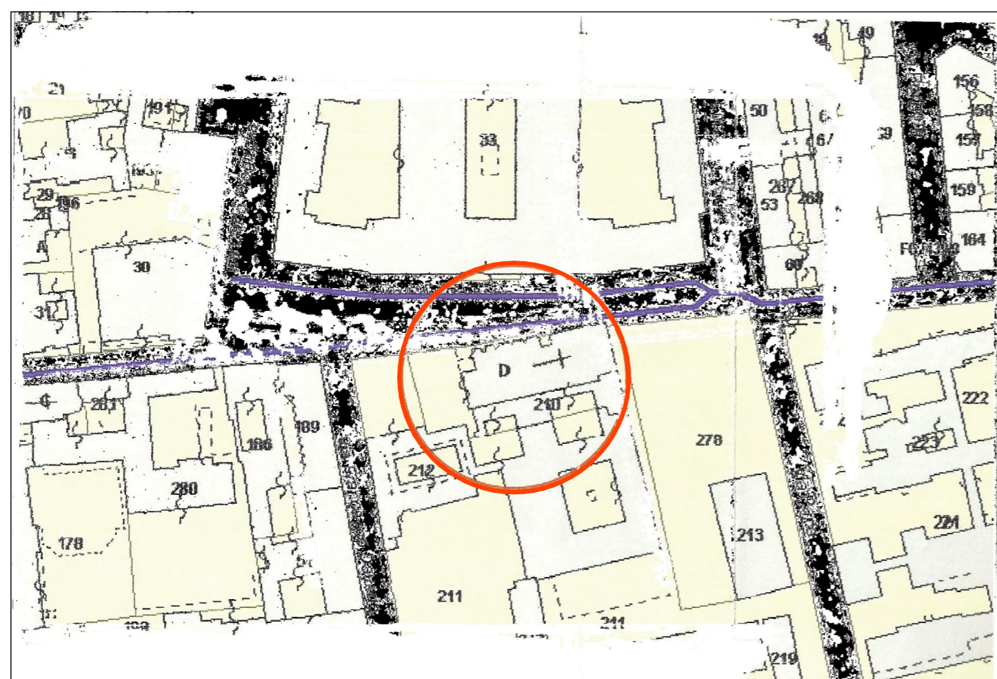
estratto di mappa - foglio 439 mapp. 210 scala 1:2000