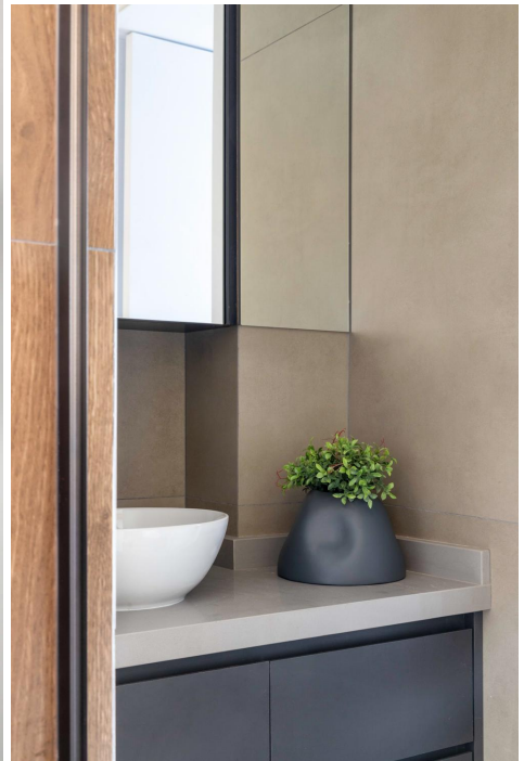
Spot Lighting (Iluminação), Catarinense (Marcenaria e Serralheria), Damme e Eliane (Revestimentos).