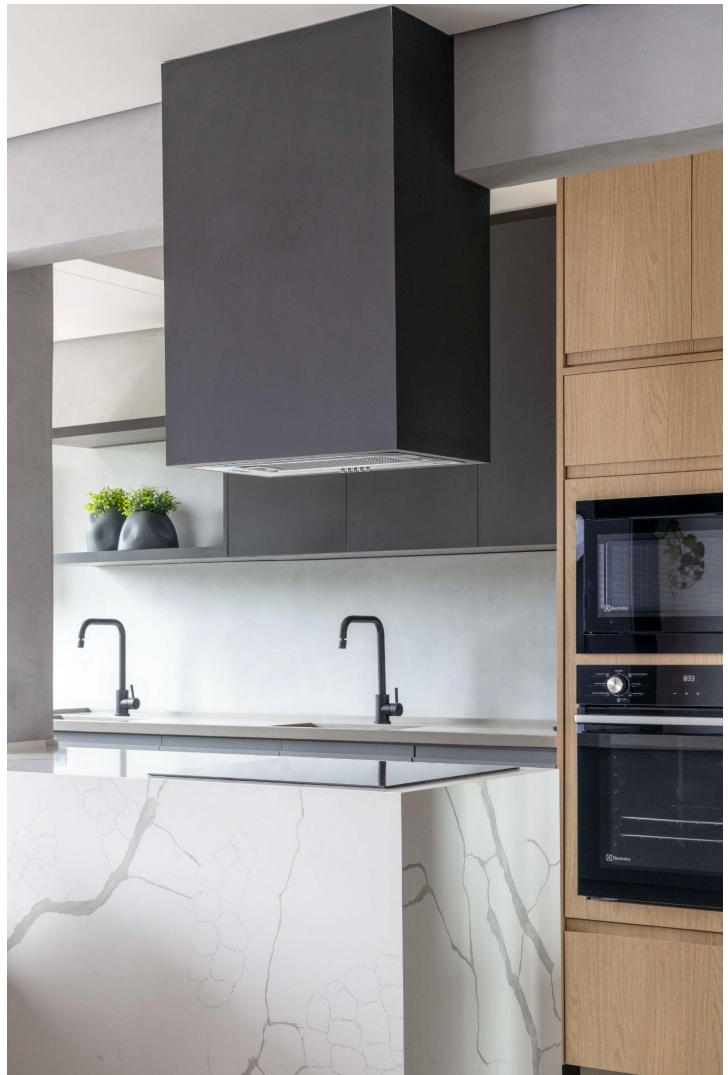
Spot Lighting (Iluminação), Catarinense (Marcenaria e Serralheria), Damme e Eliane (Revestimentos).