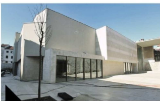
Kazalište lutaka *** Nestrpljivo očekujemo početak funkcioniranja kazališta arhitekta Marušića

Mediterranski javni prostor Obalna skalnada, urezana u rivi uz minimalno korištenje arhitektonske dramaturgije, st