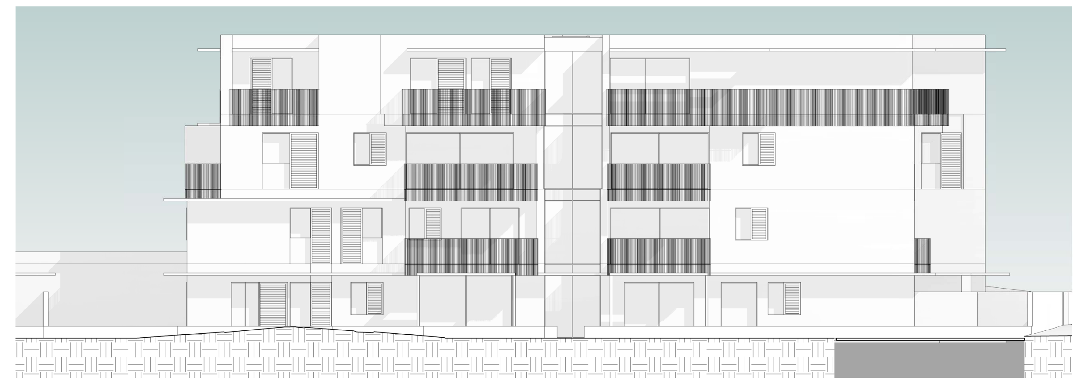
Fabbricato E: prospetto OVEST