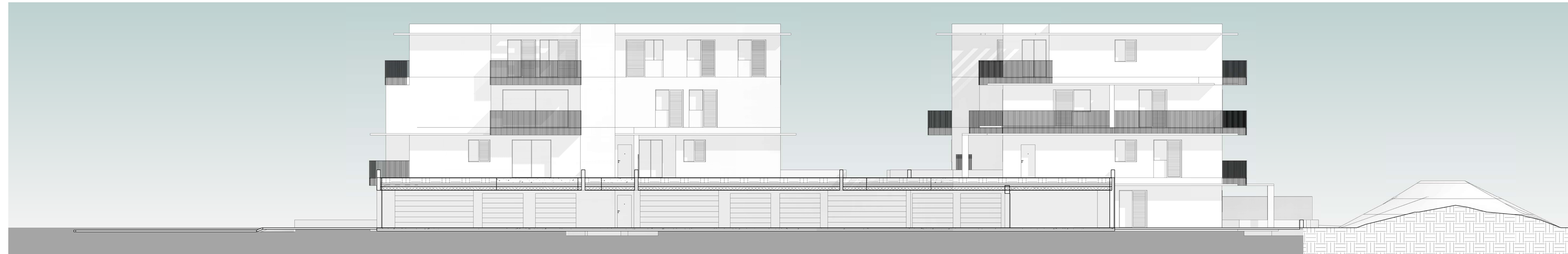
Fabbricati E - F: prospetto NORD