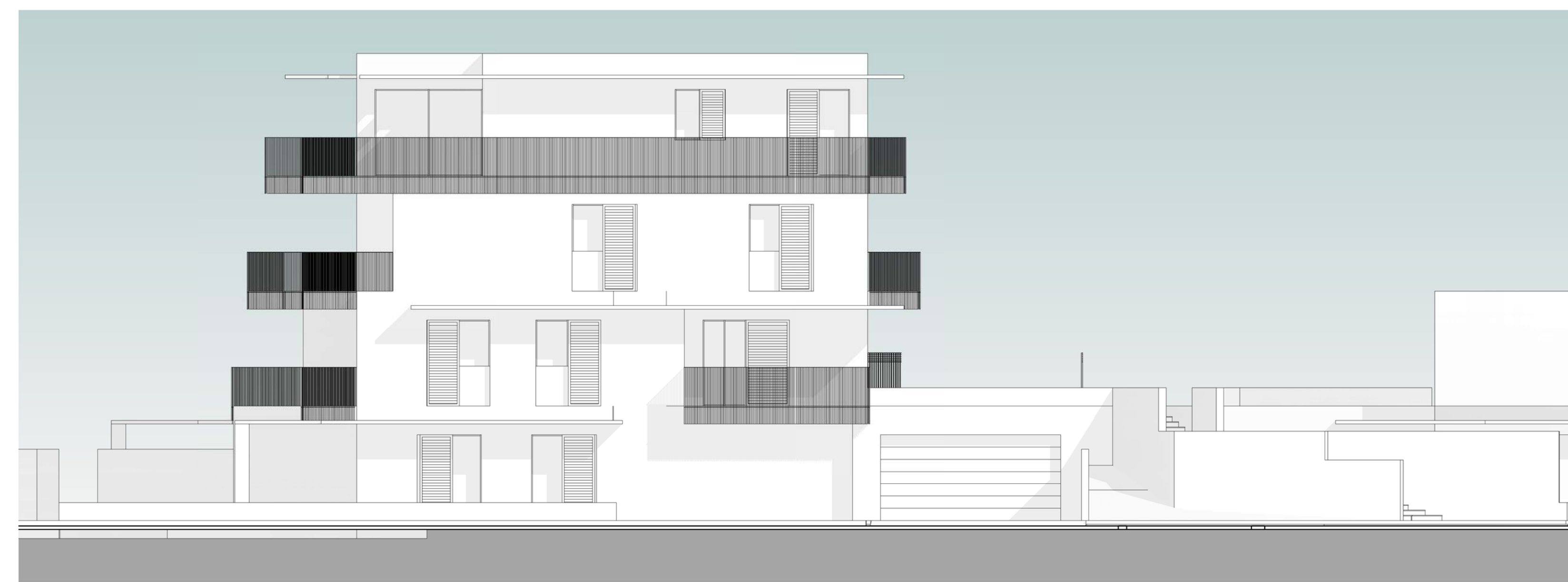
Fabbricato F: prospetto EST