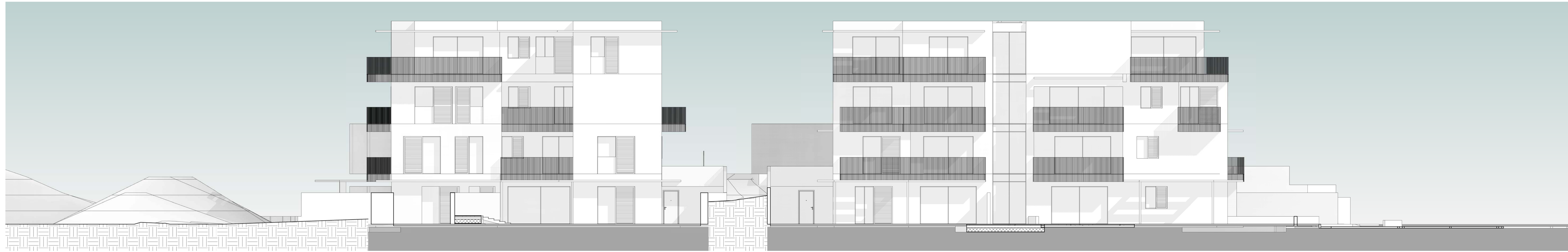
Fabbricati E - F: prospetto SUD