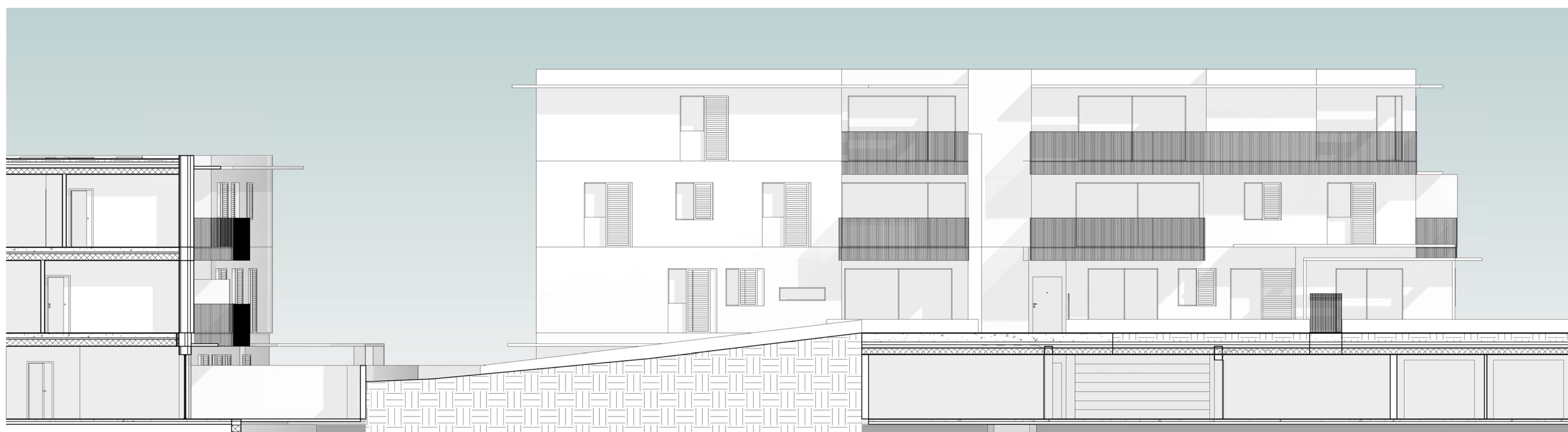
Fabbricato E: prospetto EST